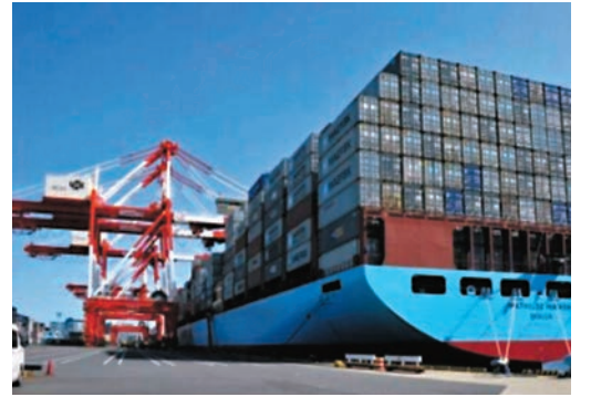
◆大部分日企認為沒必要採取對華加徵關稅措施。圖為日本橫濱港。網上圖片

與美歐採取的措施相比，日本對於是否對中國電動汽車加徵關稅表現出審慎立場，經濟產業省一名高級官員表示，電動汽車目前僅佔日本新車銷售市場約2%，「還沒有達到要投訴日本產業遭受損害的程度。」《日本經濟新聞》也指出，中國是日本重要的貿易夥伴，兩國有着緊密的經貿關係，日本很難採取提高關稅等措施。