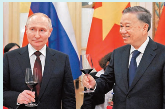
◆普京（左）和蘇林在河內歌劇院舉行的招待會上舉杯。

普京首先出席蘇林為他舉行的歡迎儀式。現場鳴放多響禮炮，兩人之後檢閱儀仗隊並舉行會談。普京表示，俄高度重視包括越南在內的東盟成員發展對話，強化與越南的全面戰略夥伴關係，是俄其中一個優先事項，又指兩國有意在亞太建立一個可靠的安全架構。普京並邀請蘇林到莫斯科，出席明年衛國戰爭勝利80周年紀念活動，希望能討論雙邊關係發展的所有迫切問題。