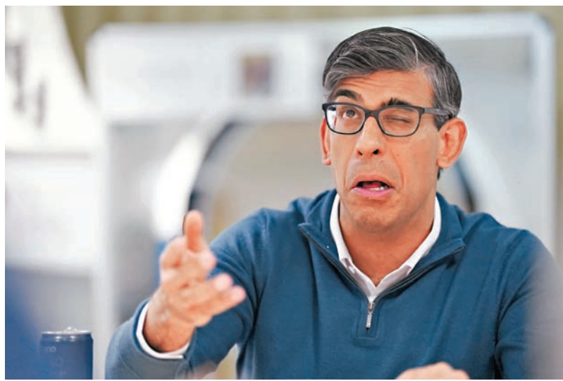
◆蘇納克在競選期間訪問薩福克郡塞茲韋爾。

英國何時舉行新一輪大選，去年以來已引發各界猜測。根據英國制度，大選日期由首相拍板定案，但需提早至少25個工作天宣布。