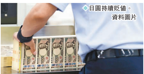
日圓持續貶值。資料圖片

現貨金價周三持穩2,323美元水平升幅擴大，周四曾向上觸及2,345美元水平近兩周高位。歐元走勢偏軟，美元指數連日徘徊105水平，不過美國10年期債息過去兩個月持續從4.7%水平逐漸回落至本周的4.2%附近之後，現貨金價過去兩個月已大致守穩2,280至2,300美元之間的主要支持區，走勢有上移傾向。預料現貨金價將反覆走高至2,350美元水平。