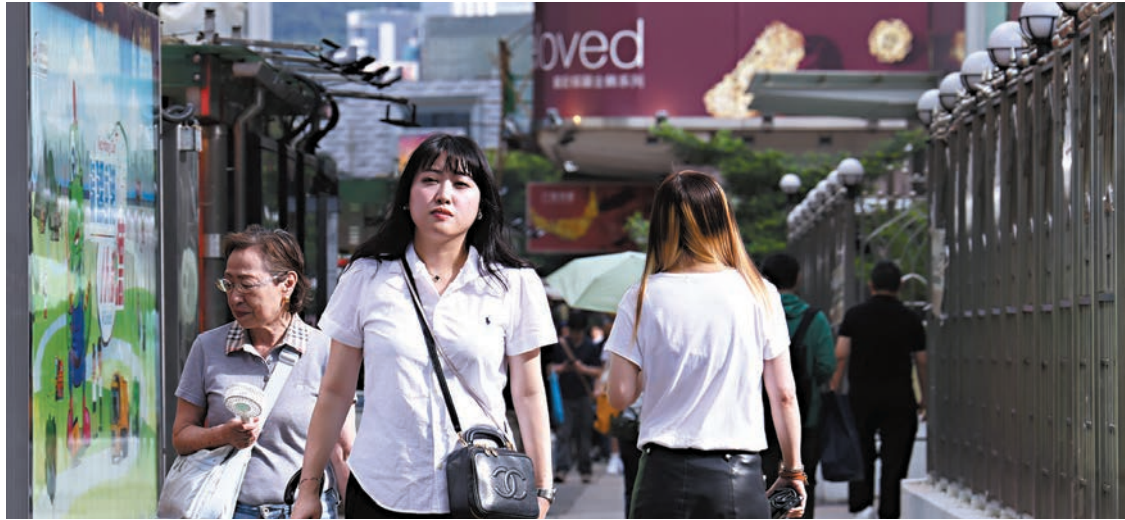
◆ 亞太地區城市化進程和消費支出持續提升，分析料有助於鞏固整個地區強勁的內需，有利房地產行業。圖為香港街頭。

部分地區國家的人口更年輕、教育程度更高，加快了科技應用步伐，同時提高電子商務滲透率，在疫情期間和之後持續推動對物流設施的需求。服務