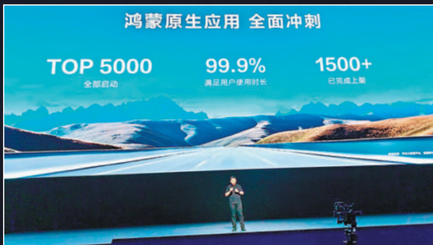
◆TOP 5000 應用已加入鴻蒙生態。