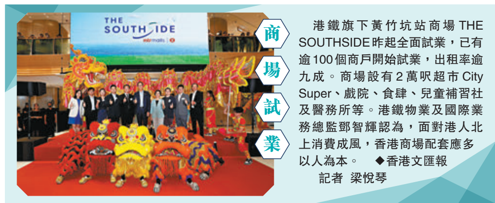
港鐵旗下黃竹坑站商場 THE SOUTHSIDE 昨起全面試業，已有逾100個商戶開始試業，出租率逾九成。商場設有2萬呎超市 City Super、戲院、食肆、兒童補習社及醫務所等。港鐵物業及國際業務總監鄧智輝認為，面對港人北上消費成風，香港商場配套應多以為人為本。◆香港文匯報記者 梁悅琴

場，彰顯維穩市場的決心。本周滬指累計下跌1.14%，深成指、創業板指分別周跌2.03%、1.98%，滬綜指和深成指已連跌六周。