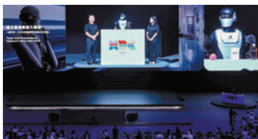
◆人形機器人「夸父」亮相華為開發者大會。