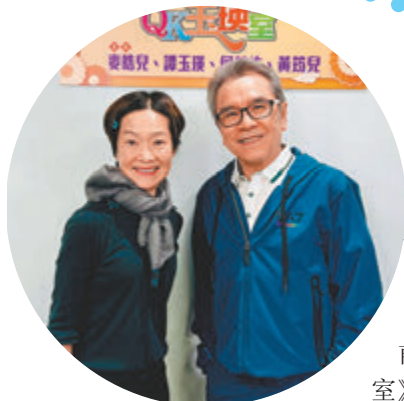
◆姜大衛接受譚玉瑛訪問。