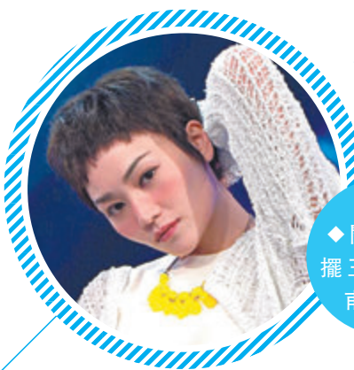
◆關嘉敏大擺王菲招牌甫士。