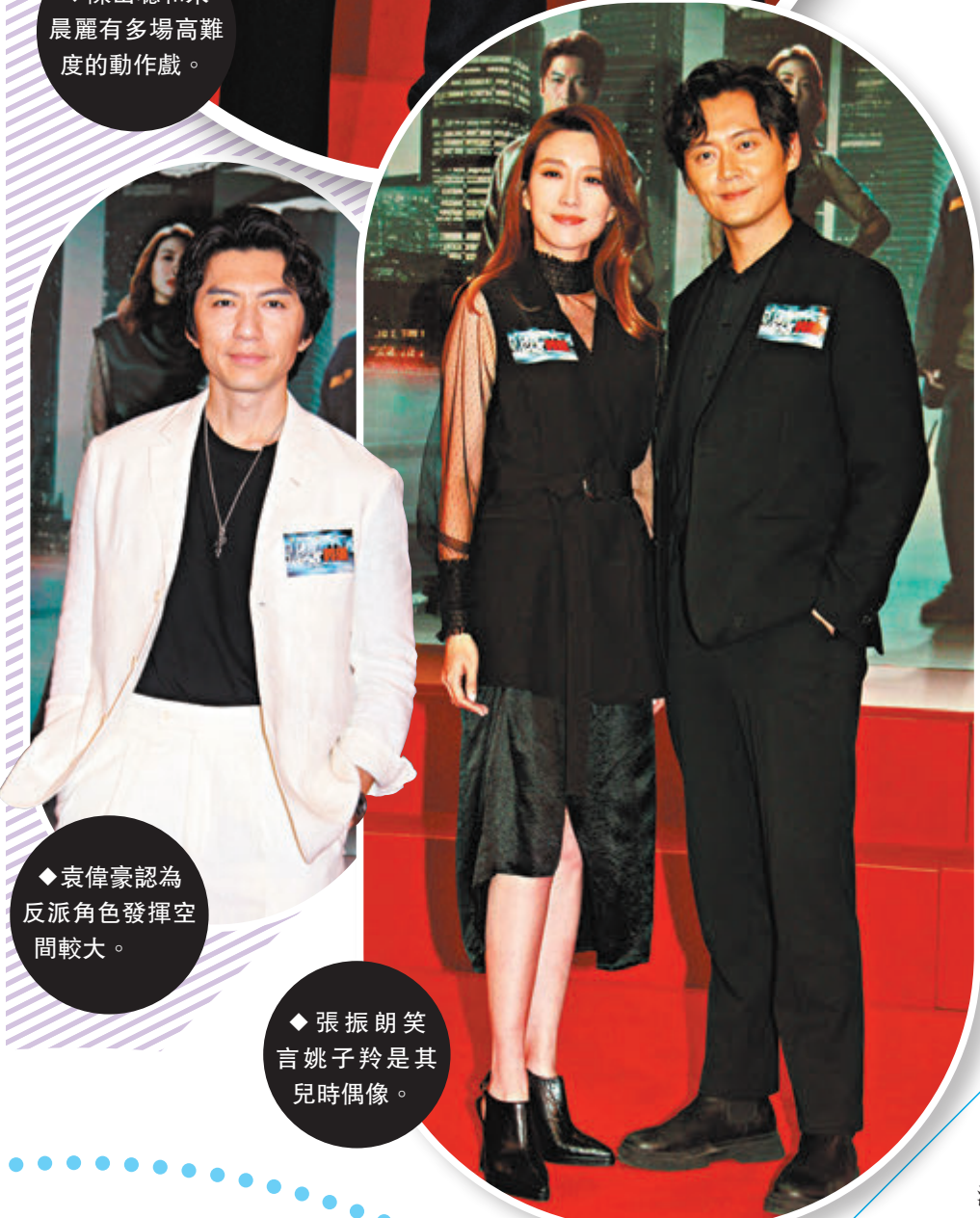
◆袁偉豪認為反派角色發揮空間較大。