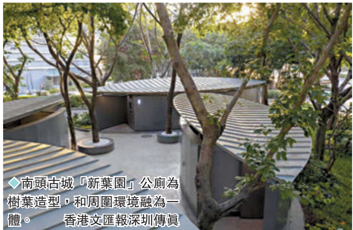
◆南頭古城「新葉園」公廁為樹葉造型，和周圍環境融為一體。香港文匯報深圳傳真