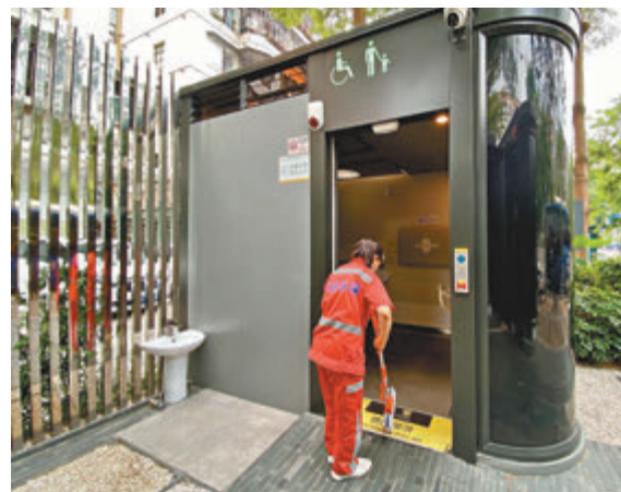
◆招商路「朗讀亭」有專人打掃衛生，環境十分乾淨無異味。