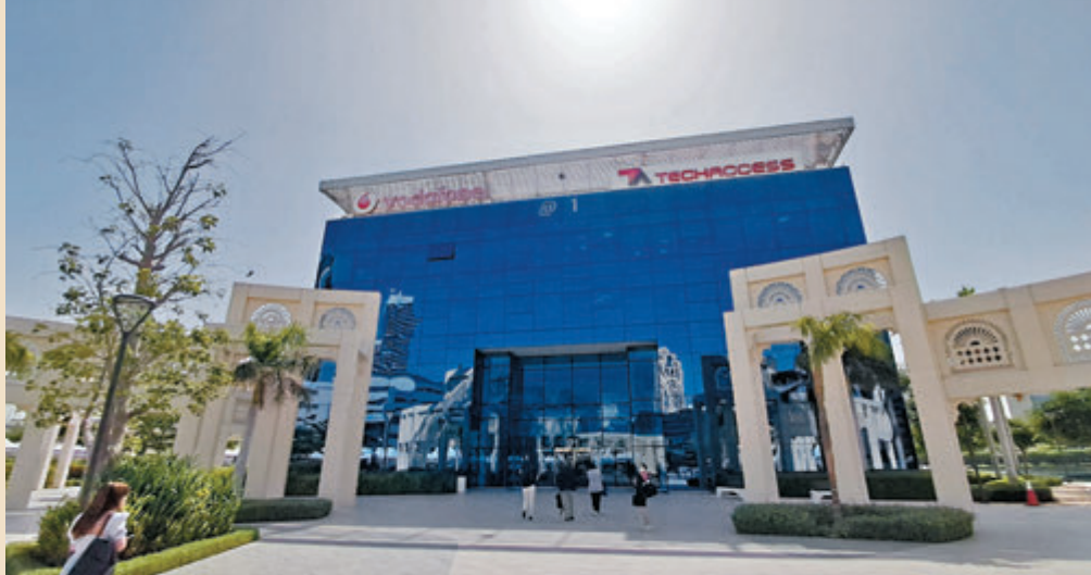
◆ 迪拜網絡城（Dubai Internet City，DIC）是容納世界各地大企業國際創新中心，許多中國企業和遊戲公司都已在DIC設立總部，包括華為（右圖）、騰訊、小米和抖音等。