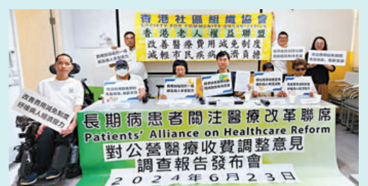
◆調查顯示約57.2%受訪者不贊成調整公營醫療收費。

他說，基層市民及領取傷殘津貼的受惠人，經常因收入較低及求診率較高，導致出現醫療開支佔收入比例較大的情況，認為政府應改善並加強宣傳醫療費用減免制度，避免非領取綜援的病人因病致貧。改善醫療費用減免制度方面，他指可參考申請撒瑪利亞基金的家庭定義而作出修訂，如按申請在職家庭津貼的入息及資產限額，上調醫療費用減免制度的各項限額水準，以及簡化審批程序及統一減免限期為12個月，減少對申請人造成的不便並減省行政成本。