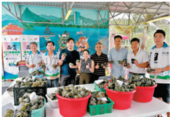
◆坑口東關愛隊的成員和義工一同包裹糰子派贈予街坊，喜迎端午。

臨近端午節，坑口東關愛隊聯同坑口西關愛隊、翠林關愛隊、坑口鄉事委員會以及各村代表和一百多位義工，一起包裹糰子，把美味送給社區內的居民。這項公益活動名為「萬糰同心為公益·全城傳承糰是情」，團隊事以一星期的時間作籌備工作，由備料、清洗糰葉，到包糰、煮