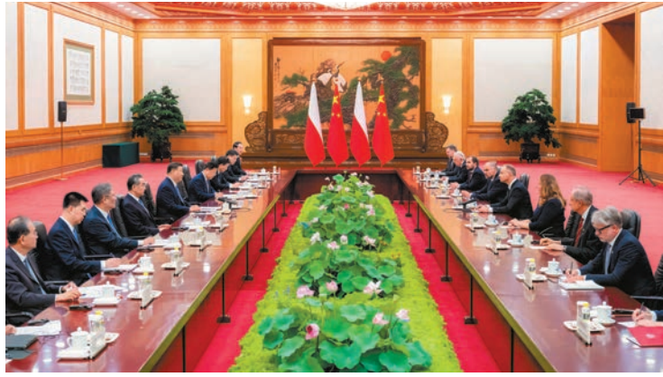
◆6月24日下午，國家主席習近平在北京人民大會堂同來華進行國事訪問的波蘭總統杜達舉行會談。新華社

香港文匯報訊 據新華社報道，6月24日下午，國家主席習近平在北京人民大會堂同來華進行國事訪問的波蘭總統杜達舉行會談。雙方就烏克蘭危機交換了意見。習近平強調，中方在烏克蘭危機上的立場就是勸和促談、政治解決。當前應努力避免衝突擴大激化，努力推動局勢降溫，努力創造和談條件。這符合包括歐洲在內的國際社會利益。中方反對一些人藉口中俄正常貿易轉移矛盾，抹黑中國。中方鼓勵和支持一切有利於和平解決危機的努力，推動構建均衡、有效、可持續的歐洲安全架構。中方願繼續以自己的方式為政治解決烏克蘭危機發揮建設性作用。