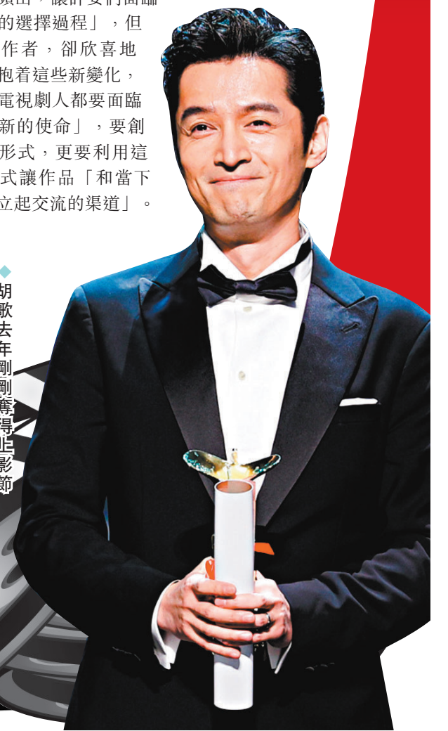
胡歌去年剛剛奪得金影節影帝。