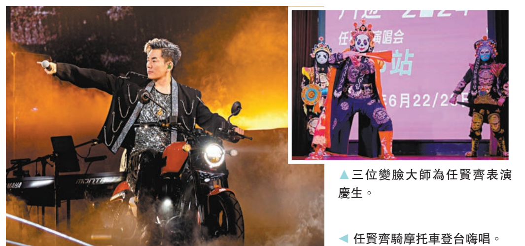
三位變臉大師為任賢齊表演慶生。