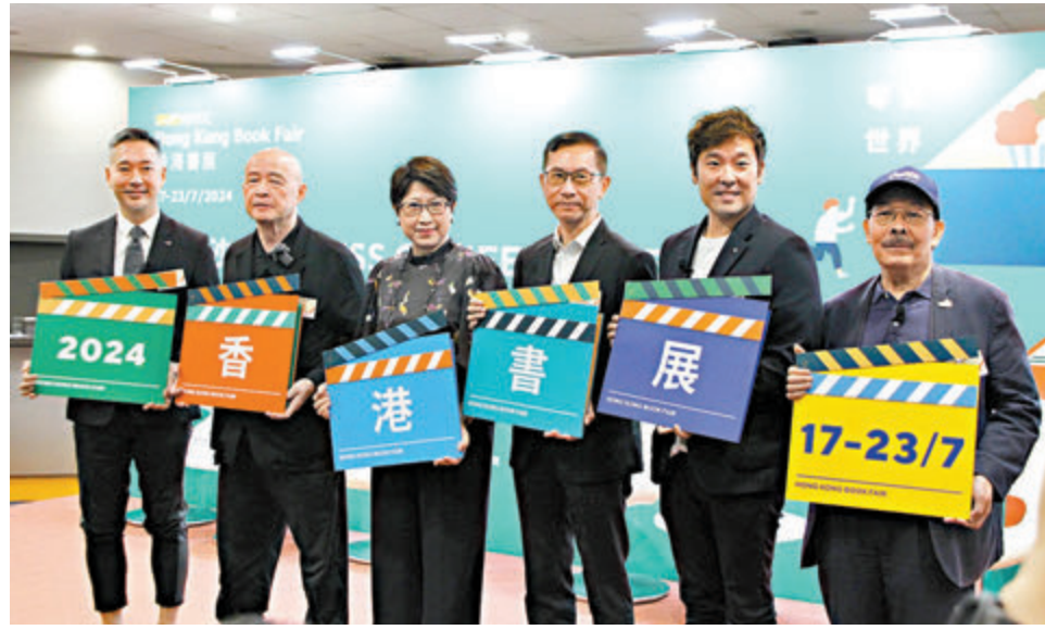
貿發局昨日舉行記者會，講解書展詳情。