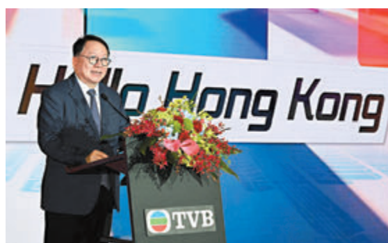
◆陳國基昨日在電視廣播有限公司舉辦的「Hello Hong Kong」活動上致辭。

香港文匯報訊 香港特區政府政務司司長陳國基昨日訪問上海，在政商民各層面促進滬港兩地的交流合作。他在出席「Hello Hong Kong」活動致辭時表示，影視娛樂是香港流行文化的重要元素，也是香港中外文化交流的重要領域，具有「香港味道」的影視作品在內地大有可為。特區政府會繼續大力推動香港電視台與內地以至世界各地的夥伴深化交流合作，將香港流行文化在粵港澳大灣區以至全球華人社區更好地發揚光大。