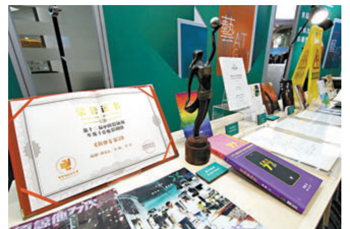
部分影視作品展品。