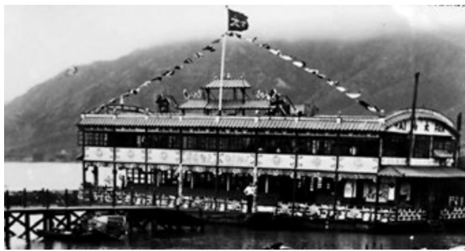
▲圖為曾於屯門青山灣經營的第二代太白海鮮舫。