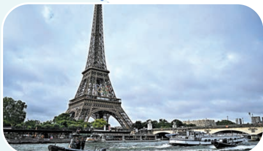
◆今屆開幕式破天荒在著名地標塞納河上演。