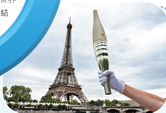
◆巴黎奧運火炬出自設計名師之手。