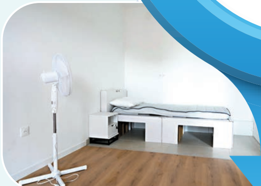
◆選手村有以回收紙材、漁網製成的床板及床墊。