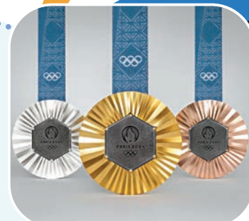
◆今屆奧運獎牌由法國百年珠寶品牌打造。