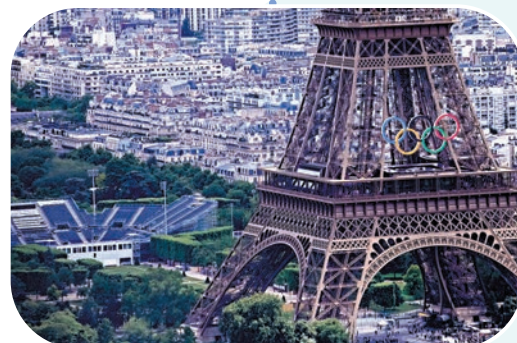
◆賽會於艾菲爾鐵塔旁興建臨時場館。