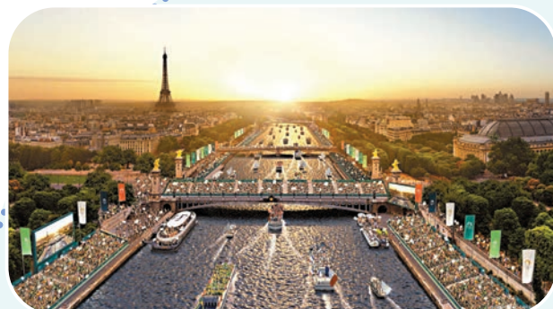
◆巴黎奧運開幕式的預想圖。