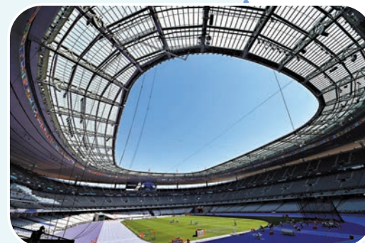
◆法蘭西體育場將會出現奧運史上首條紫色跑道。