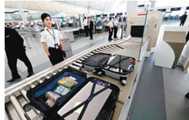
◆採用新智能安檢系統後，旅客無須預先取出液體、電子物品等單獨過機。