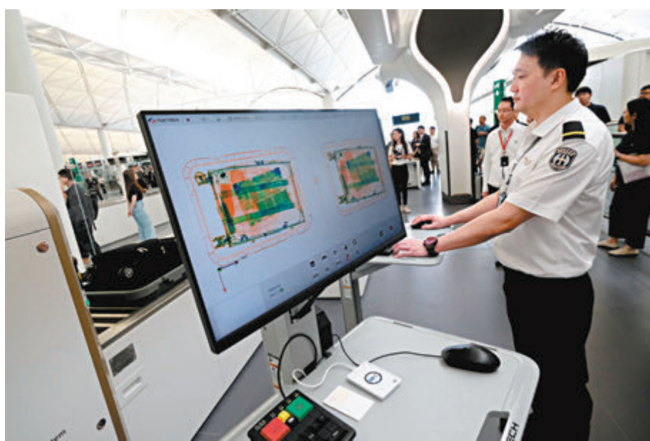
◆機管局由下月2日起分階段引入智能安檢系統，包括採用電腦斷層X光機，能呈現三維影像，掃描時間可縮短至10秒。