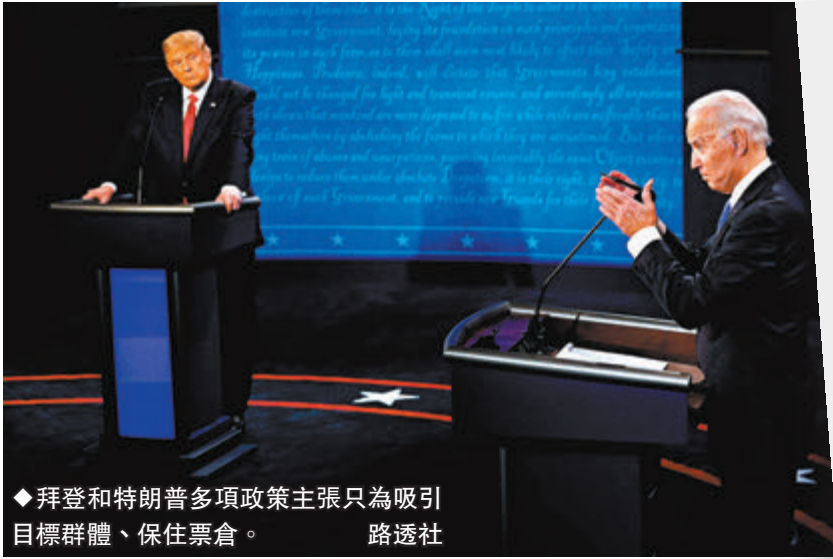
◆拜登和特朗普多項政策主張只為吸引目標群體、保住票倉。

香港文匯報訊 美國總統拜登與前總統特朗普將於當地時間周四(6月27日)晚上,參加今屆總統大選的首場電視辯論,選民的抉擇將影響美國未來4年、甚至更長遠的發展方向。美國有線新聞網絡(CNN)政治記者柯林森指出,兩名候選人均乏善可陳,不論最終哪一人當選,美國深陷的內政和外交危機均難望迎刃而解,美國民眾的不安全感將繼續揮之不去。