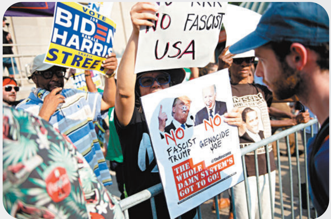
◆美國選民集會抗議,表達對兩名總統候選人的不滿。

民調發現,60%共和黨人對於特朗普獲得黨內提名感到滿意,但對拜登持同樣看法的民主黨人僅佔42%。分