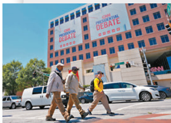
◆CNN收視率不斷下跌,希望透過主持辯論提高收視率。

香港文匯報訊 今屆美國總統大選首場電視辯論由美國有線新聞網絡(CNN)主持。《華爾街日報》分析稱,對於近年營運受挫、黃金時段收視率不斷下滑的CNN,主持今次辯論相信有助提振其收視率。不過想要避免4年前電視辯論中特朗普多次打斷辯論的混亂局面,保證辯論秩序,將是CNN的一大挑戰。