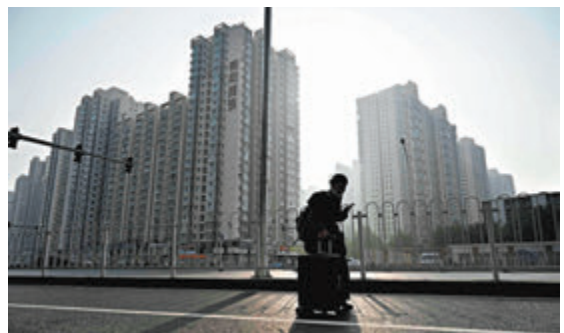
◆北京昨公布，明確首套房最低首付比例調整至20%，利率最低調整為3.5%。資料圖片

市逐步落實各項舉措，接下來市場有望進入政策效果兌現期。作為四個一線城市中最後一個調整房貸首付和利率政策的城市，此次北京政策信號意義很大，有助於進一步增加購房者的市場信心，對於後續市場行情提振具有積極的作用。