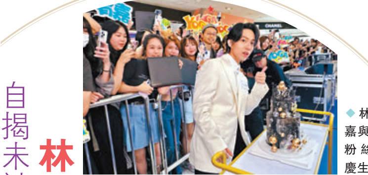
◆林宥嘉與到場粉絲提前慶生。