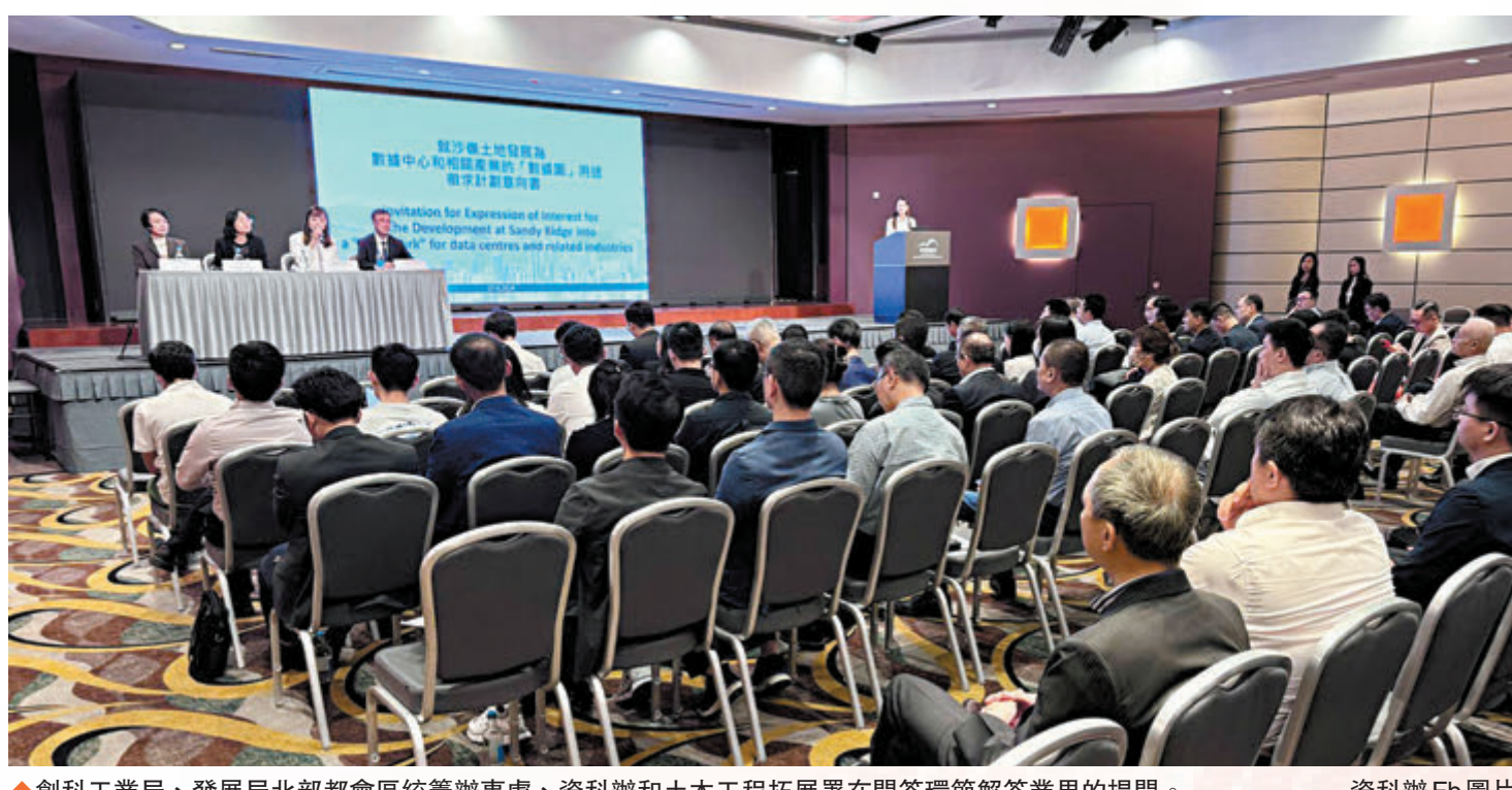
◆ 創科工業局、發展局北部都會區統籌辦事處、資科辦和土木工程拓展署在問答環節解答業界的提問。