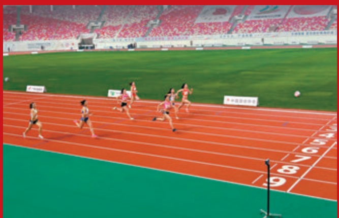
◆十五運田徑項目(不包括馬拉松、競走)將在廣州舉行。圖為廣州天河體育場。