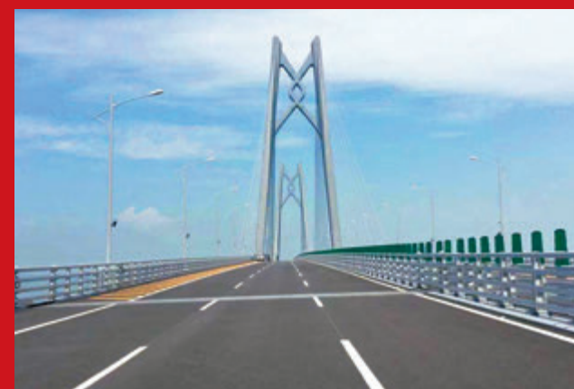
◆港珠澳大橋路面寬闊,設施先進,十分適合舉辦馬拉松賽和公路單車賽。圖為港珠澳大橋橋面。香港文匯報記者敖敏輝攝

根據通報,十五運會分為競體比賽和群眾賽事項目,其中,競體比賽設34個大項401個小項,群眾賽事項目設23個大項166個小項。在賽事布局方面,按照「廣東為主、港澳優先」的原則開展。具體而言,競賽方面,廣東將承辦350個小項,香港承辦37個小項,澳門承辦14個小項。群眾項目方面,廣東、香港、澳門分別承辦152個、6個和8個小項。