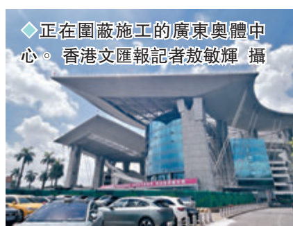
◆正在圍蔽施工的廣東奧體中心。

香港文匯報訊(記者 敖敏輝 廣州報道)記者從通報會上獲悉,廣東已明確承接十五運會競體項目場館78個,90%以上利用現有場館進行維修改造。殘特奧會34個比賽場館中,有21個場館與十五運會使用同一場館。據預計,絕大部分的場館將在2024年底完工,2025年3月底前完成所有場館維修建設工作。