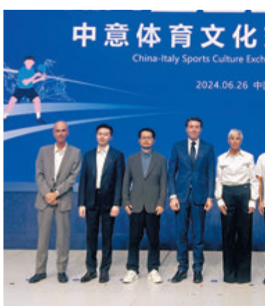
◆十五運會倒計時紀念活動在廣東多地舉行。

廣東賽區項目的分布,以廣州、深圳為核心,粵港澳大灣區城市為重點。根據安排,廣東省內競體項目共15個城市承辦賽事,其中,廣州承辦136個小項,佔總小項數的34%,深圳承辦82個小項,佔總小項數的20%,另有珠海、汕頭、佛山、梅州、惠州、汕尾、東莞、中山、江門、湛江、肇慶、清遠、雲浮共13個城市參與承辦賽事。