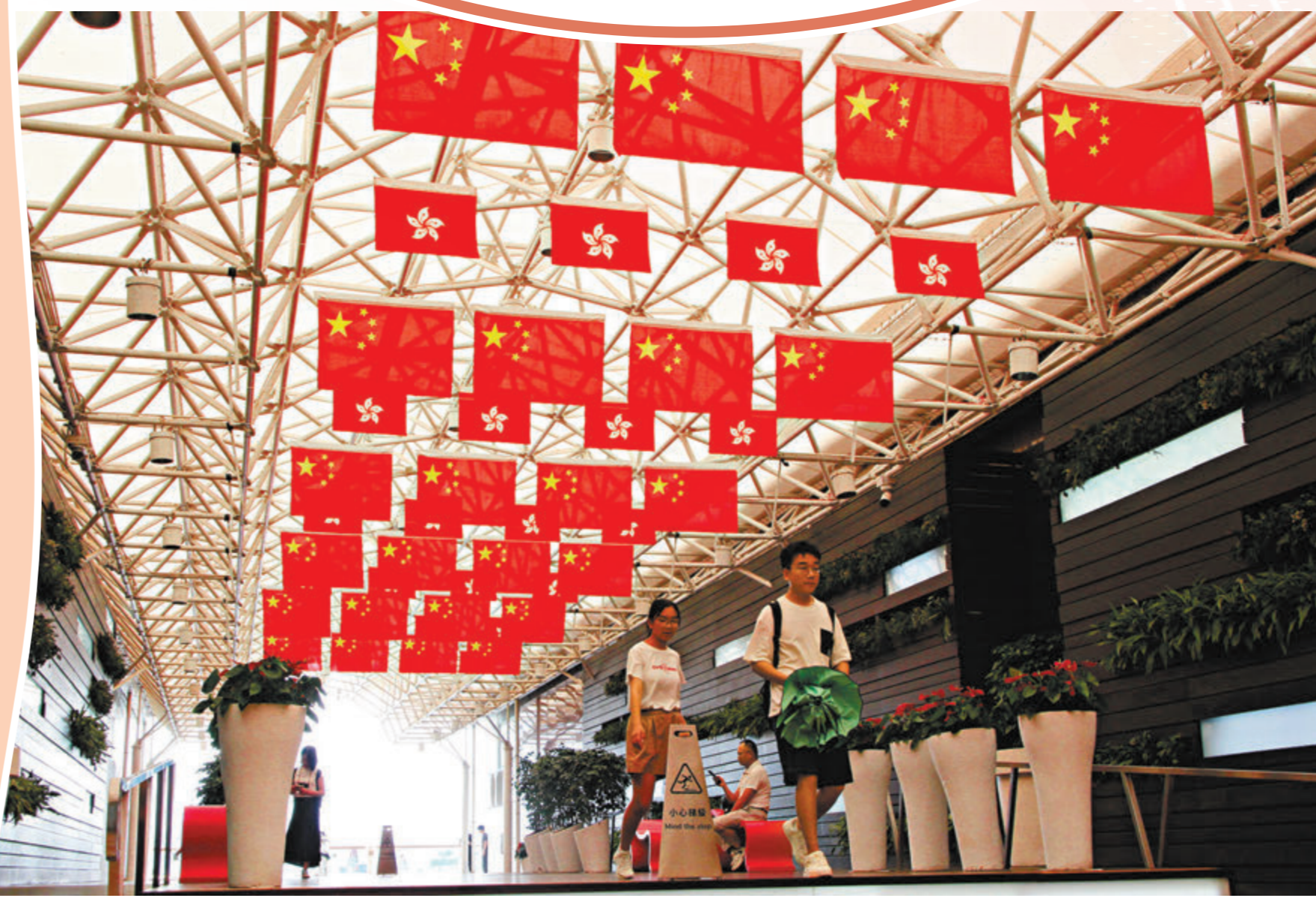
香港喜迎回歸祖國27周年，近日香港街頭一片喜慶。

本屆特區政府即將迎來上任兩周年，兩年來，特區政府堅守「一國」之本，發揮「兩制」之利，着力完善維護國家安全法律框架，完善各項法律體系，鞏固香港法治；着力提高治理水平，完善選舉制度，優化地區治理體系，促進行政和立法互動優化提升治理能力和治理效能；透過學校和紀律部隊推廣、公務員培訓全方位加強國民教育，加強憲法和基本法宣傳，優化愛國主義教育工作；大力發展旅遊、推動盛事經濟，透過「十八區日夜都繽紛」等各種措施提振地區經濟，不斷增強發展動能。 今天的香港，正走向由治及興，多位香港市民接受香港文匯報訪問時表示，特區政府過去兩年的努力，令市民看到香港的積極變化，他們希望未來在特區政府的帶領下，在香港生活得更幸福。多位政界人士亦讚揚特區政府的積極作為，表示未來將與特區政府攜手為港人謀福利，為香港謀發展。 ◆香港文匯報記者 胡恬恬、黃書蘭、藍松山