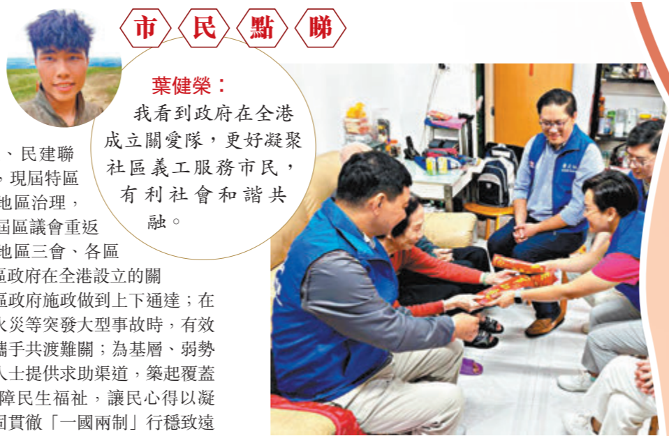
關愛隊積極支援政府地區工作和服務市民的地區網絡徹底覆蓋全港。資料圖片

在完善選舉制度，落實「愛國者治港」原則之後，行政立法關係煥然一新。特區行政長官李家超在上任後，即推出前廳交流會、行政長官立法會互動交流答問會等措施。至今，特區政府已舉行了15次前廳交流會，4次行政長官立法會互動交流答問會。許多議員表示，這些措施令他們能更有效地向政府表達市民意見，從而加強行政和立法機關之間的溝通，讓雙方有更多機會展開良性互動。 行政立法互動優化，令特區政府的施政效率提升，在行政立法的積極配合下，香港更嚴謹而高效地完成了《維護國家安全條例草案》審議，履行了香港完成基本法第二十三條本地立法的憲制責任。 隨着會議時間得以充分利用，立法會大會的效率亦有所提升。在2023年度，立法會共完成審議134項先訂立後審議的附屬法例，政府亦動議了14項議案並全部獲得通過；議員就政府工作提出了150項口頭質詢和840項補充質詢，以及488項書面質詢；立法會共進行了45項無立法效力的議員議案辯論，就公眾關注的事項反映民意。這些都顯示政府透過深度交流與合作，翻開了香港良政善治的新篇章。