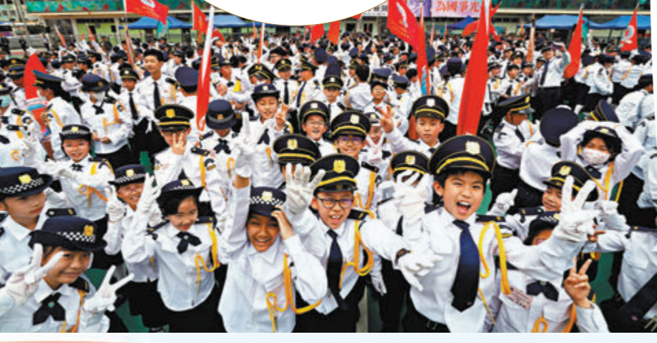
關愛隊積極支援政府地區工作和服務市民的地區網絡徹底覆蓋全港。資料圖片