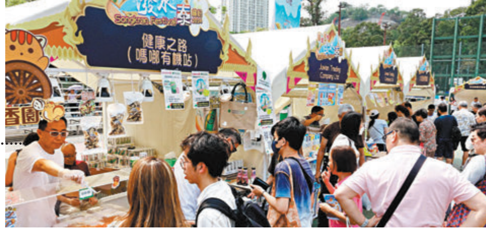
關愛隊積極支援政府地區工作和服務市民的地區網絡徹底覆蓋全港。