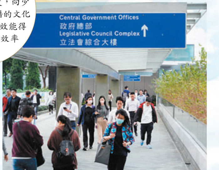
政府部門不分你我，上下一心發展經濟，改善民生，大大提升公共行政效率。資料圖片