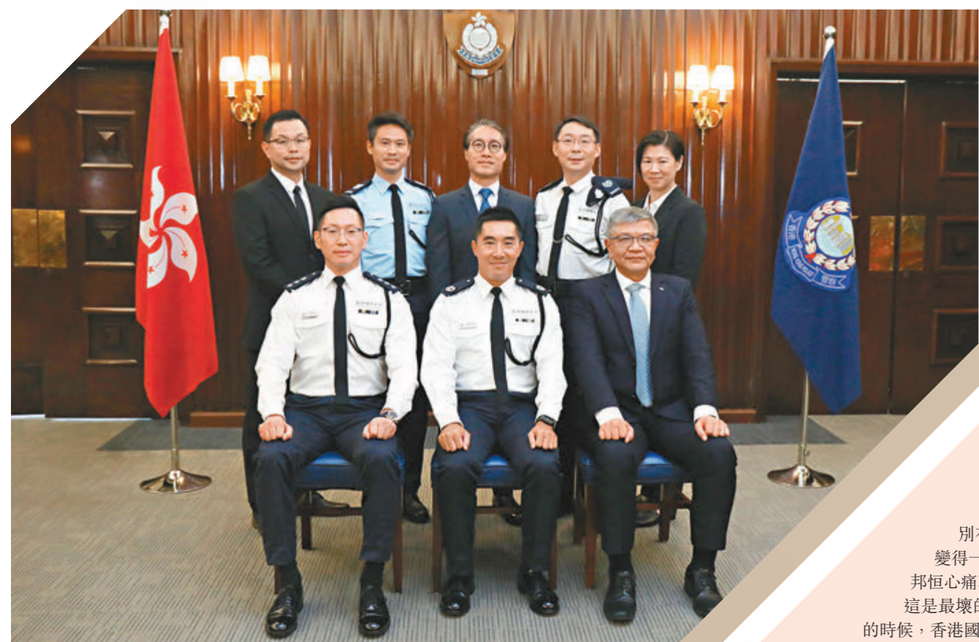
◆後排左起：警員林森勝、警長潘劍儀、高級督察謝志偉、警署警長黃邦恒、警長郭芷澄。前排左起：總管司葉智文、警務處處長陳思達、高級警司陳江明。