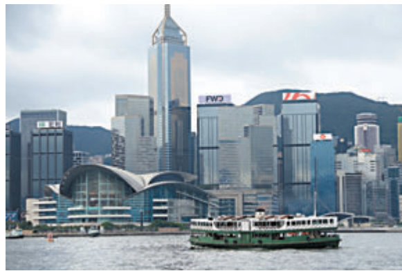
◆特區政府強烈不滿美國全球宗教自由報告涉港內容。資料圖片

香港文匯報訊 香港特區政府昨日發表聲明，對於美國所謂2023年全球宗教自由報告，假借宗教自由之名，行詆毀香港特區人權等方面的狀況之實，表示強烈不滿和反對。