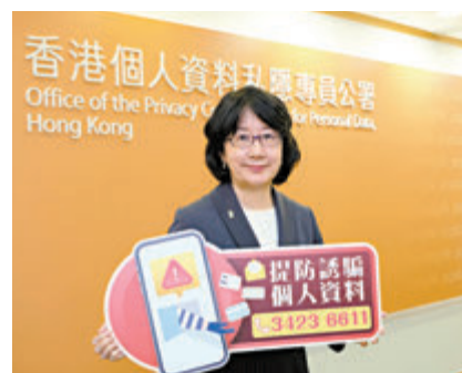
◆私隱專員鍾麗玲談人工智能普及下，如何保障個人資料。資料圖片

她深信該模範框架有助孕育AI在香港的健康及安全發展，促進香港成為創新科技樞紐，推動香港以至大灣區的數字經濟發展。