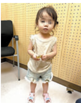
◆兩歲女童疑遭遺棄在洗衣街兒童遊樂場。