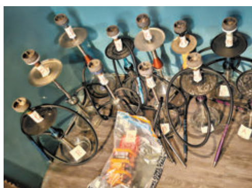
◆行動中執法人員檢走多支連同水煙膏的吸食水煙工具作為證物。