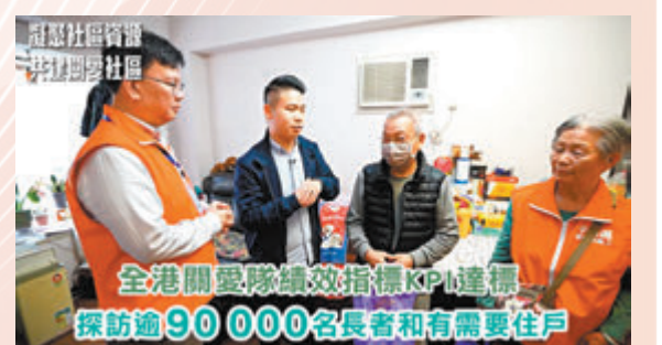
◆民青局上載影片回顧成立兩年來的工作成果。視頻截圖

在推進婦女發展方面，已於2023年6月成立的婦女自強基金，每年會撥款2,000萬元予婦女團體及非政府機構推行相關項目支援婦女。至今已