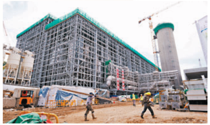
◆香港首座現代化垃圾焚化發電設施將於明年落成。

談及一波三折的垃圾徵費實施之路，謝展寰坦言，儘管每個決定背後都有現實考量，暫緩實施亦是該局主動提出，但他的心情難免「複雜、有不開心」。他指垃圾徵費在上屆特區政府任內已制定法例，今屆特區政府的責任是繼續推行，「有意見指政府事前諮詢不足，其實當時垃圾徵費已經是法例，並不能夠再諮詢大家法例要如何訂立。」