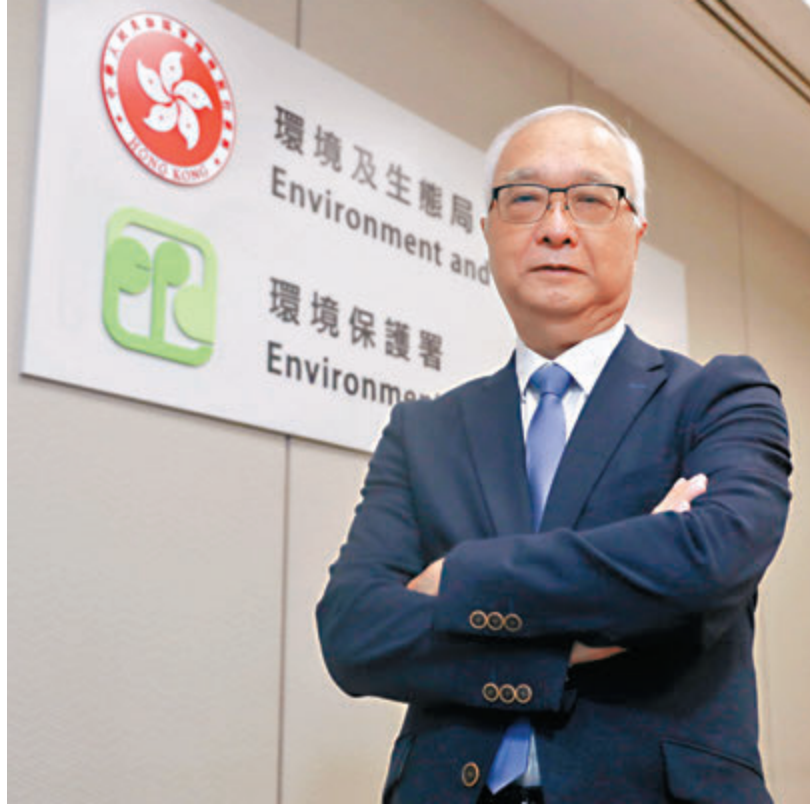
◆謝展寰形容，落實垃圾徵費需要兩條腿走路。