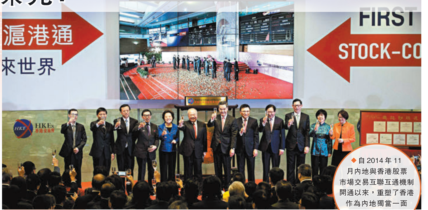
◆ 自2014年11月內地與香港股票市場交易互聯互通機制開通以來，重塑了香港作為內地獨當一面的門戶角色。