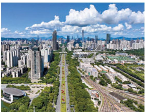
◆ 中央及香港特區政府一直以來重視粵港澳大灣區建設，推動大灣區內的人才流動。資料圖片

馬威在廣州、深圳、佛山、東莞、澳門和香港6個城市設有8個辦公室。畢馬威在粵港澳大灣區7個城市及地區擔任全球招商合夥人，利用全球網絡和資源助力政府招商引資，發揮國際專業服務機構的最大效能，助力各地政府打造具有競爭力的營商環境，講好大灣區故事。