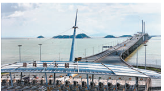
◆「港車北上」政策實施迎來一周年，圖為車輛途經港珠澳大橋收費站。

香港文匯報訊（記者 方俊明 珠海報道）「港車北上」政策實施迎來一周年。香港文匯報記者6月30日從港珠澳大橋邊檢站獲悉，自去年7月1日該政策實施以來，截至今年6月30日16時，經該站查驗的出入境「港車北上」數量已突破95萬輛次，完成「港車北上」邊檢備案的駕駛員已超過8.2萬人次，車輛已超過6.7萬輛次。有港人受訪時表示，「港車北上」助力灣區遊成為熱門。也有港青在珠海成立公司，坦言「港車北上」給創業就業帶來了更多機遇。