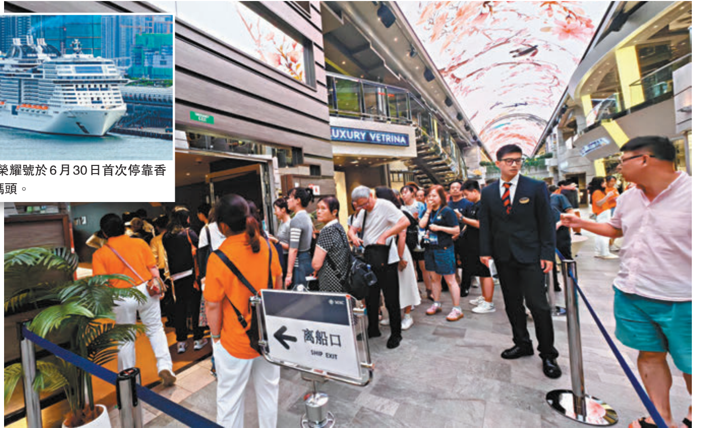
◆郵輪乘客等待下船到香港遊玩。