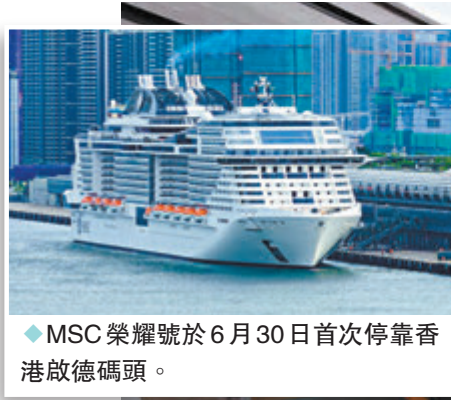
◆MSC榮耀號於6月30日首次停靠香港啟德碼頭。