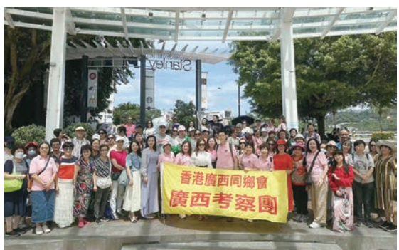
◆廣西同鄉會鄉親活動大合照。