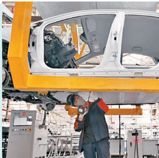
◆最新採購經理指數顯示，內地經濟運行整體穩定，惟市場尚存需求不足情況。