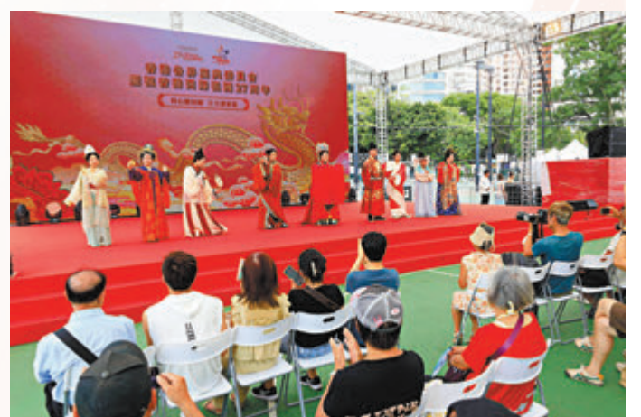
◆市民觀賞維園中華文化展的表演節目。