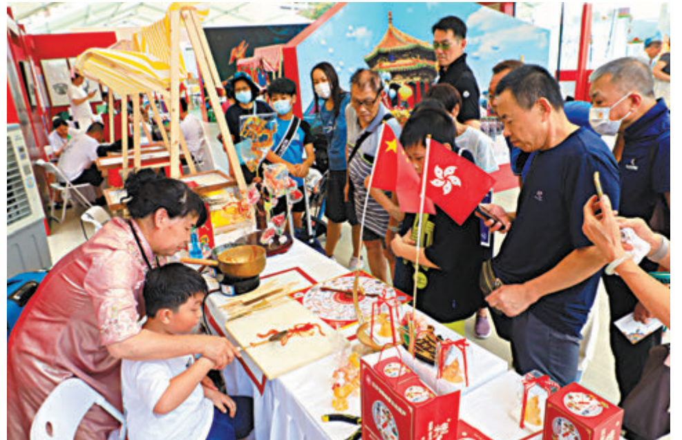
◆慶祝香港回歸祖國27周年維園慶回歸活動吸引不少市民參加。