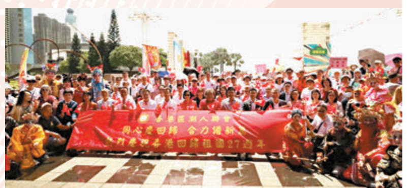
◆香港區潮人聯會昨日舉辦「同心慶回歸 合力譜新篇」慶回歸活動。

香港文匯報訊（記者子京）香港區潮人聯會昨日舉辦「同心慶回歸 合力譜新篇」慶祝香港回歸祖國27周年活動。英歌舞、潮州大鑼鼓等傳統非遺文化在西環中山公園精彩上演，健壯有力、節奏強烈的英歌舞，還有震撼人心的鑼鼓音樂，為慶回歸活動增添了熱烈喜慶的氣氛。現場還有潮汕特色美食攤位，來自社會各界嘉賓、聯會會員、街坊400餘人參加，歡度回歸佳節。