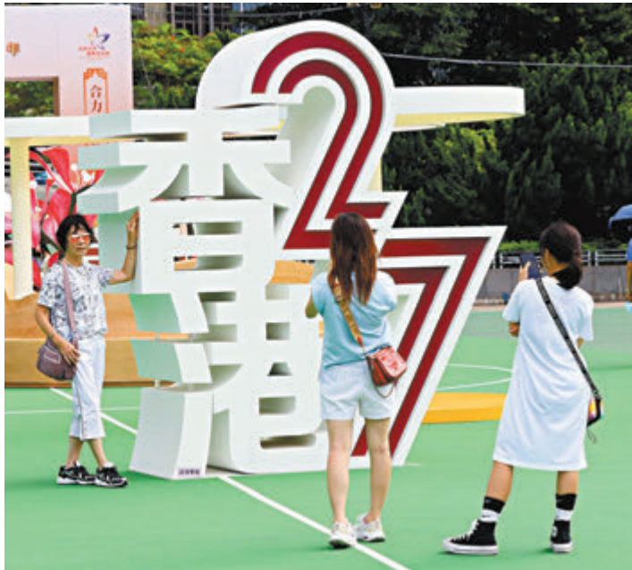
◆市民於「香港27」擺設下打卡。