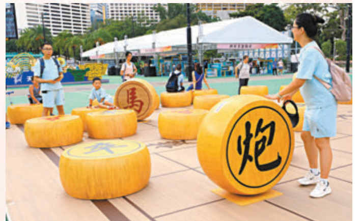
◆市民開心與象棋擺設合照。