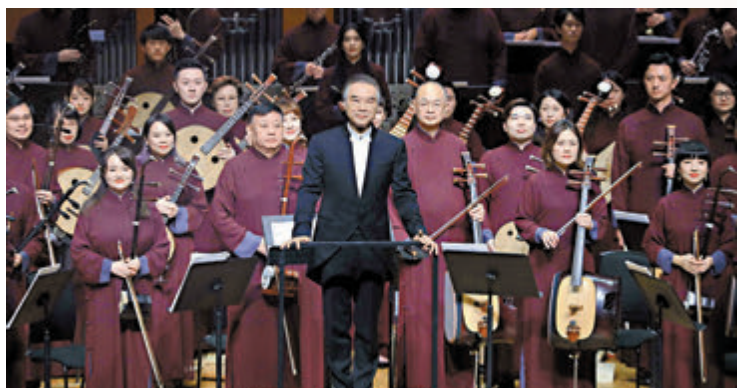
◆香港中樂團辦國風音樂會，弘揚中華傳統文化底蘊。