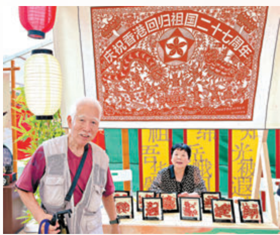
◆85歲的譚爺爺在慶祝香港回歸祖國27周年的剪紙畫前駐足良久。