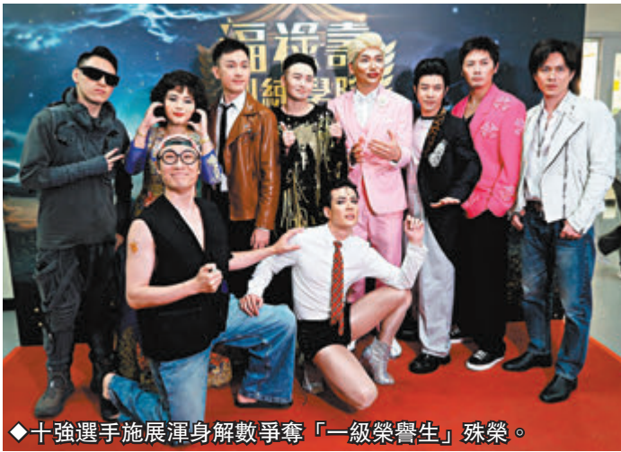
◆十強選手施展渾身解數爭奪「一級榮譽生」殊榮。

當晚王祖藍的媽媽、太太李亞男和兩個女兒都有到場欣賞，打頭陣出場的表演嘉賓汪明荃（阿姐），身穿黑色高衩旗袍，獻唱國語歌《舞女》，又唱又跳十分有睇頭。阿姐唱完後，王祖藍、阮兆祥和李思捷向她頒發「榮譽博士」，祖藍說：「阿姐係『福祿壽』嘅伯樂，冇佢我哋冇今日。」阿姐說：「與『福祿壽』正式合作已是14年前，唔敢講伯樂，但自己作為前輩真心想畀後輩多啲機會，一個人的真心一定要被看見。」向來專業的阿姐笑言今次造型是精心設計，在練習上都有下苦功，是一個大挑戰，不過她就不會再扮嘢。