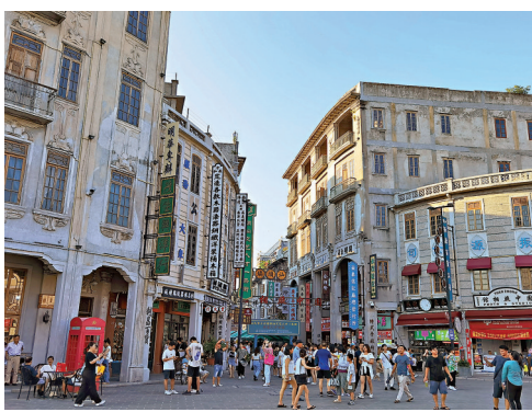
◆汕頭小公園歷史文化街區。

當然，潮汕人執拗固執、愛憎分明的個性，潮汕商幫善抓機遇、窮追猛打的經營風格也是出了名的。香港是社團社會，眾多社團中數潮汕社團「最打得」，內部不管有多大矛盾，對外只需一句「膠己人」，都能一