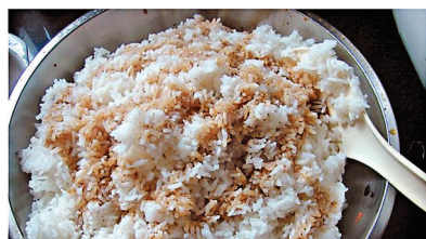
阿媽，日日「豉油撈飯」，有冇新意思呀！咁下餐同佢改過個名，叫「撈人恩飯」，咪唔一樣嘍！