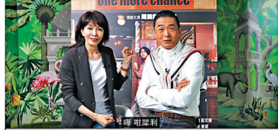
Do 姐，你而家做 YouTuber，算唔算「撈過界」呀？發哥，我而家有「撈」電視，係撈行呀！