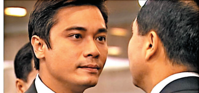
你叫我做「撈家」，你究竟知唔知「撈家」咩意思呀？ (粵語講呢啲) 豉油撈飯·撈過界·撈家·襟撈·撈世界要醒目

「撈」的讀音是「勞/lou4」；在一些廣東話方言用語上它讀「lou1/勞4-1」。「撈」有三個意思，其一指拌和；其二指打滾(做事、打工)；其三指取得，尤指用不正當的手段。以下是與「撈」相關的廣東話方言用語：