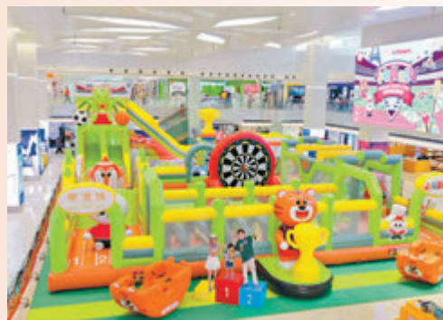
◆盛夏彈跳運動會設九大彈跳運動體驗區。

暑假期至，是時候為小朋友安排新奇刺激的活動，一起大玩特玩！為迎接7月國際體壇盛事將至，東港城與新加坡大型兒童室內遊樂場品牌Kiztopia再度攜手合作，由即日起至7月24日打造「東港城 x Kiztopia Jumpptopia 盛夏彈跳運動會」，讓大家投入運動樂趣！總面積逾5,300呎、高逾6.5米的巨型一體式充氣樂園化身彈跳運動會，加入多項運動元素，包括田徑、足球、籃球、運動攀登、馬術等，考驗小朋友毅力、眼界及準確度，在玩樂的同時也能保持身心健康。