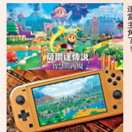
◆《薩爾達傳說》新作終於是薩爾達當主角了！