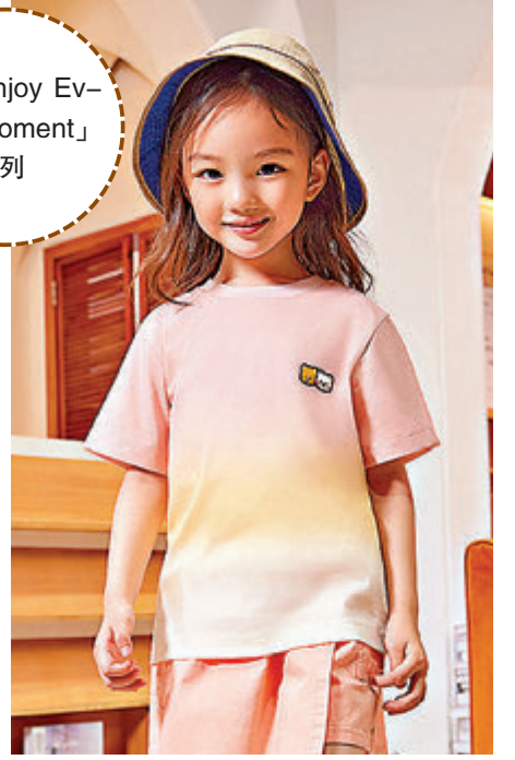
◆「Enjoy Every Moment」服飾系列