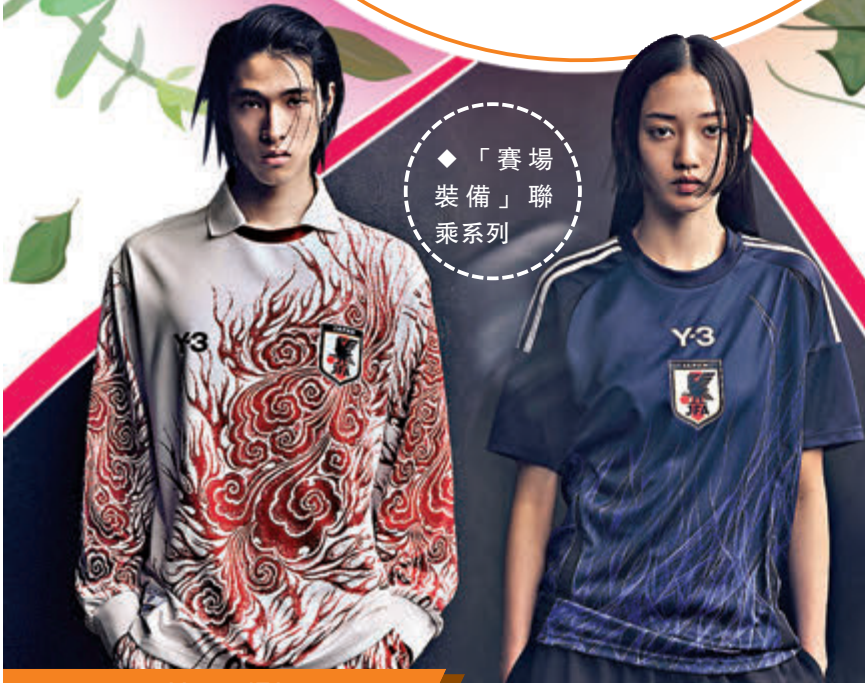
◆「賽場裝備」聯乘系列

延續全新Capsule系列的夏日主題，Love, Bonito於今個月推出超過50款全新設計單品，從鉤針編織至精緻刺繡，以及一種散發着陽光般光澤感的全新輕盈纖維物料，還有一系列適合夏日婚禮和派對風格的服飾。同時，今個月還聯乘Sephora及RARE SkinFuel獨家購物禮遇，購物滿指定金額，有機會免費獲贈Supergoop!防曬霜旅行裝，或RARE SkinFuel抗衰老護膚體驗裝。