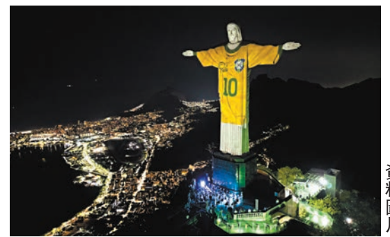
比利是巴西的不朽傳奇。資料圖片

巴西《聯邦政府公報》當地時間2日公布，總統盧拉簽署法令，確定每年11月19日為「球王比利日」。選擇這一日期是因為比利在1969年11月19日在馬拉簡拿球場攻入了自己的第1,000個入球。該場比利所在的桑托斯與華斯高的比賽，比利在第79分鐘射入一球12碼，成為他的第1,000個入球。這一法令來自聯邦眾議員杜奇和卡雷拉斯的提案。去年12月提案在眾議院通過，之後提交參議院審議；參議院通過後，今年6月11日提交總統簽署。比利出生於1940年10月23日，曾代表巴西國家隊參賽92場，攻入77球，奪得1958、1962、1970年三屆世界盃冠軍。他於2022年12月29日去世，享年82歲。 ◆新華社