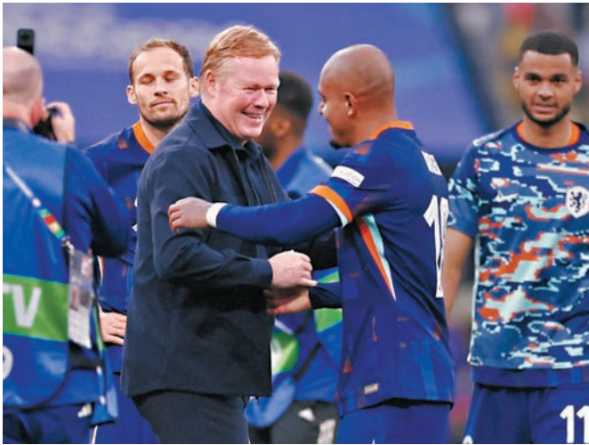
朗奴高文與當耶爾馬倫慶祝勝利。路透社

慢慢調整踢法 把握力有改善空間 這位荷蘭名帥表示，加普在20分鐘打破僵局後，全隊雖然創造了很多機會，但直到第83分鐘，才由當耶爾馬倫攻入鎖定勝局的第二球，說明進攻效率還需要提升。「的確，賽果往往最重要，但因為我們是荷蘭隊，國內對我們的一貫要求是要踢出精彩的攻勢足球，所以我們贏球的方式往往是最困難的。」高文說：「這場比賽來看，全隊整體表現很優秀。如果想在這屆賽事走得更遠，這場球的水準，就是一個標杆。如果接下來的表現低於這個水準，那就別想能打進決賽。」 ◆新華社