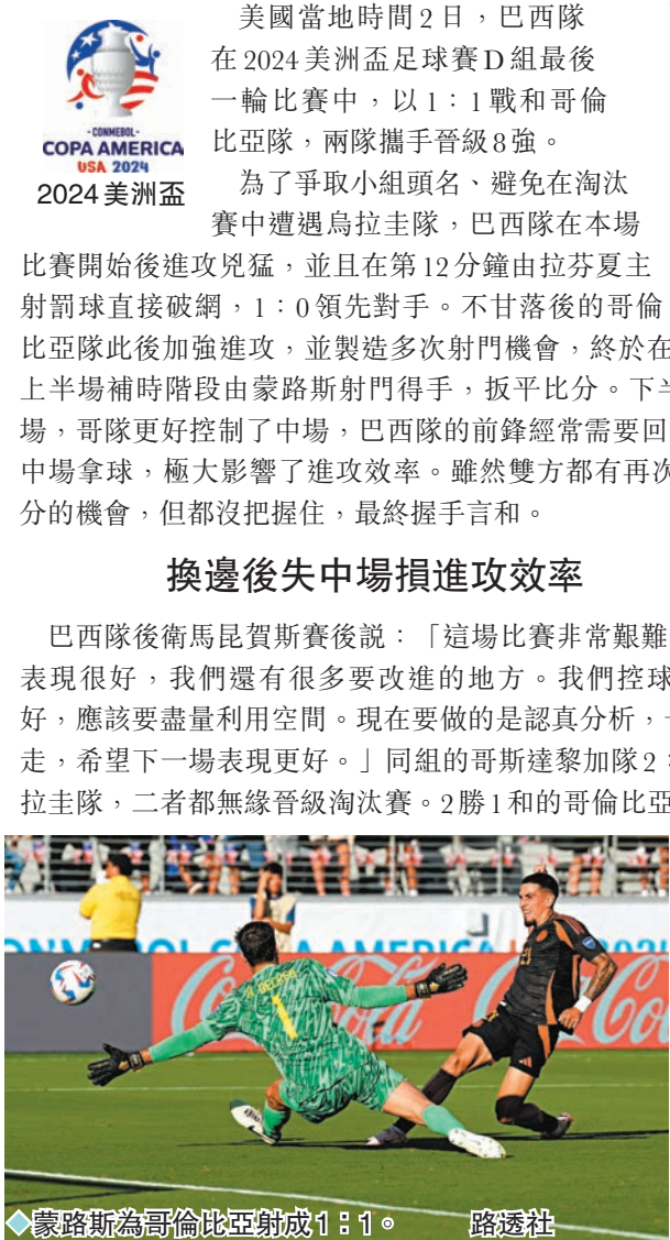
◆蒙路斯為哥倫比亞射成1:1。