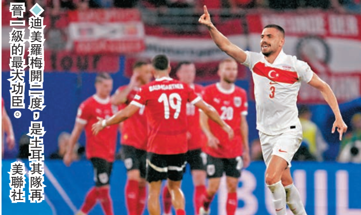
◆迪美羅梅開二度，是土耳其隊晉二級的最大功臣。

隨著荷蘭隊和土耳其隊雙雙趕上最後8強尾班車，2024歐洲國家盃首輪淘汰賽經過四天16強鏖戰，於本港時間3日凌晨悉數結束，8支球隊將會為爭奪準決賽席位作好準備。好幾位球員都在本輪淘汰賽大放異彩，包括昨晨一戰傳射建功的荷蘭前鋒加普以及梅開二度的土耳其後衛迪美羅，而在幾天前的西班牙新秀尼高拉斯威廉斯以及瑞士晉級功臣魯賓華加斯，也都讓球迷留下深刻印象。 ◆香港文匯報記者 梁志達