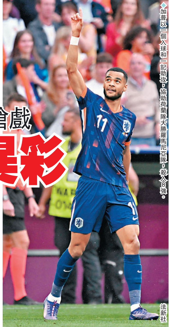
◆加普以二個入球和二記助攻，協助荷蘭隊大勝羅馬尼亞隊，殺入8強。