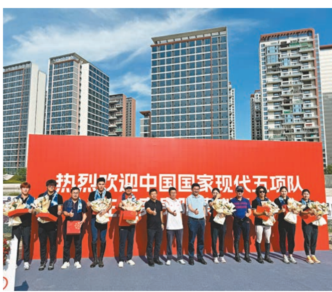
▲現代五項隊備戰集訓歡迎儀式在日前舉行。新華社