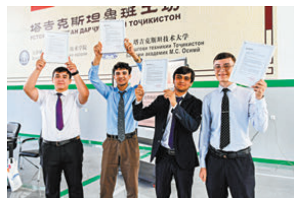
◆7月3日，在塔吉克斯坦首都杜尚別，魯班工坊赴華留學生展示錄取通知書。

他還想繼續深造，夢想今後當一名大學教師或交通運輸領域的專業測繪師。「在魯班工坊的學習經歷是我職業規劃中最重要的部分之一。」