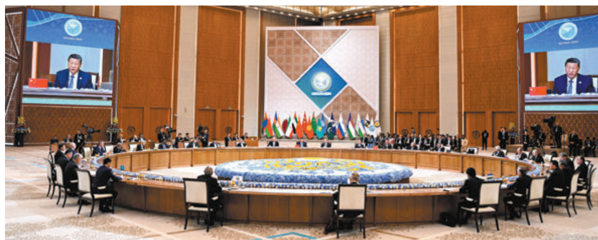
◆當地時間7月4日上午，國家主席習近平在阿斯塔納獨立宮出席上海合作組織成員國元首理事會第二十四次會議。

成員國領導人簽署並發表《上海合作組織成員國元首理事會阿斯塔納宣言》，批准上海合作組織關於各國團結共促世界公正、和睦、發展的倡議、關於完善上海合作組織運作機制的建議，發表關於睦鄰互信和夥伴關係原則的聲明以及涉及能源、投資、信息安全等領域合作的一系列決議。