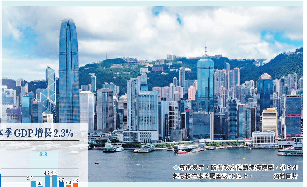
◆專家表示，隨着政府推動經濟轉型，港PMI料最快在本季尾重返50以上。