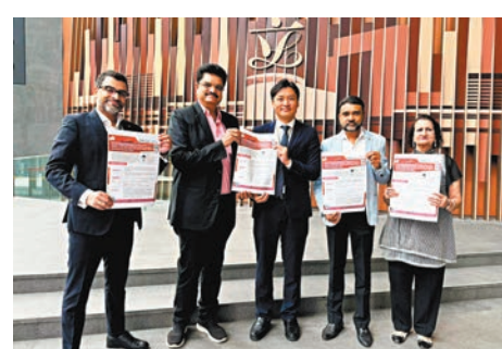
◆香港印度商界認為新措施有助非中國籍香港永久居民往內地尋找商機。

員會及鄭泳舜議員，表達持有外國護照的商界人士，往來內地從事貿易或尋找商機，辦理商務簽證，並不容易。他們從事鑽石製造及貿易，要經常往返內地，希望內地針對香港永久居民，推出出入境放寬措施。團體感謝民建聯、鄭泳舜及各方努力，內地推出新的通行證措施，並知悉最近有關單位的辦證服務預約已滿，難以預約。他們又認為，香港稅制簡單，又背靠內地，仍是他們經營業務的首選地方。鄭泳舜亦稱，感謝團體代表對香港發展仍充滿信心，他形容新措施可便利兩地人民交往及交流，仍有助非中國籍香港永久居民往內地尋找商機。鄭泳舜並指，也收