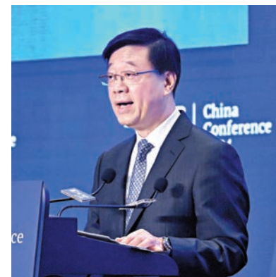
◆李家超表示，香港將能夠繼續發揮「跳板」作用。

香港文匯報訊(記者 岑健樂)行政長官李家超昨出席《南華早報》「中國年會2024」時表示，香港在「一國兩制」下優勢獨特，包括搭上國家經濟發展的快車，享有祖國強大的支援，近期國家連串惠港政策及特區政府近年努力「拚經濟、謀發展」的舉措，香港的發展機會將會持續擴大。