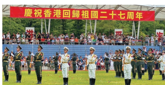
◆三百餘名香港市民於活動啓動當天參觀昂船洲駐港部隊。

為慶祝香港回歸祖國27周年，在香港中國企業協會的倡議下，香港中旅集團牽頭於6月30日啟動「旅遊服務進社區」活動，共邀請300餘名香港市民參觀昂船洲駐港部隊，內容包括觀看升旗儀式、軍樂隊表演、分列式表演、槍械儀仗、刺殺操、獵人戰鬥表演、海陸軍裝備展示以及「我和我的祖國」文藝演出等，讓香港市民尤其是青少年近距離體驗軍營生活，感受新時代駐軍官兵風采，進一步加深對國家和軍隊的了解，激發愛國主義情懷。