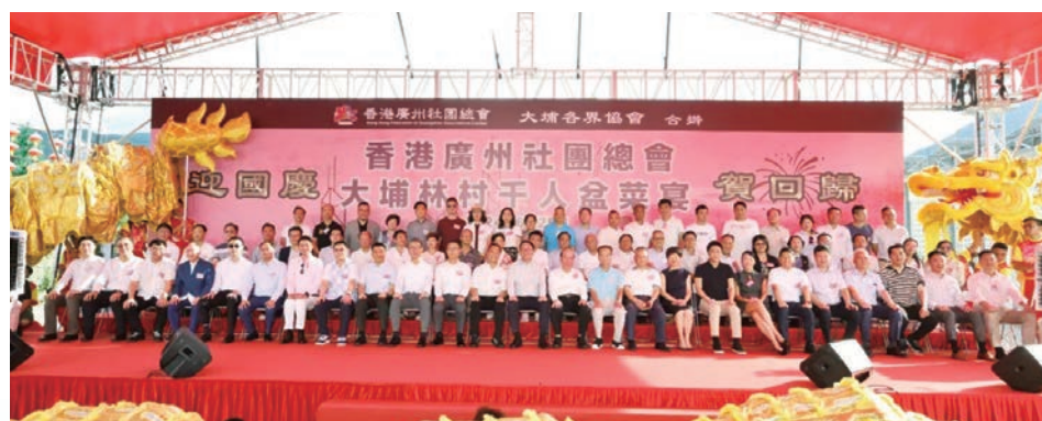
◆香港廣州社團總會大埔林村千人盆菜宴上賓主合照。

香港廣州社團總會聯同大埔各界協會日前(6月28日)於大埔林村許願廣場盛大舉辦「迎國慶 賀回歸 香港廣州社團總會大埔林村千人盆菜宴」，邀來了近2000餘名香港市民、鄉親及來賓齊聚一堂，共享盛宴。活動為廣州社總慶祝中華人民共和國成立75周年暨香港回歸祖國27周年的系列項目之一，別具意義。