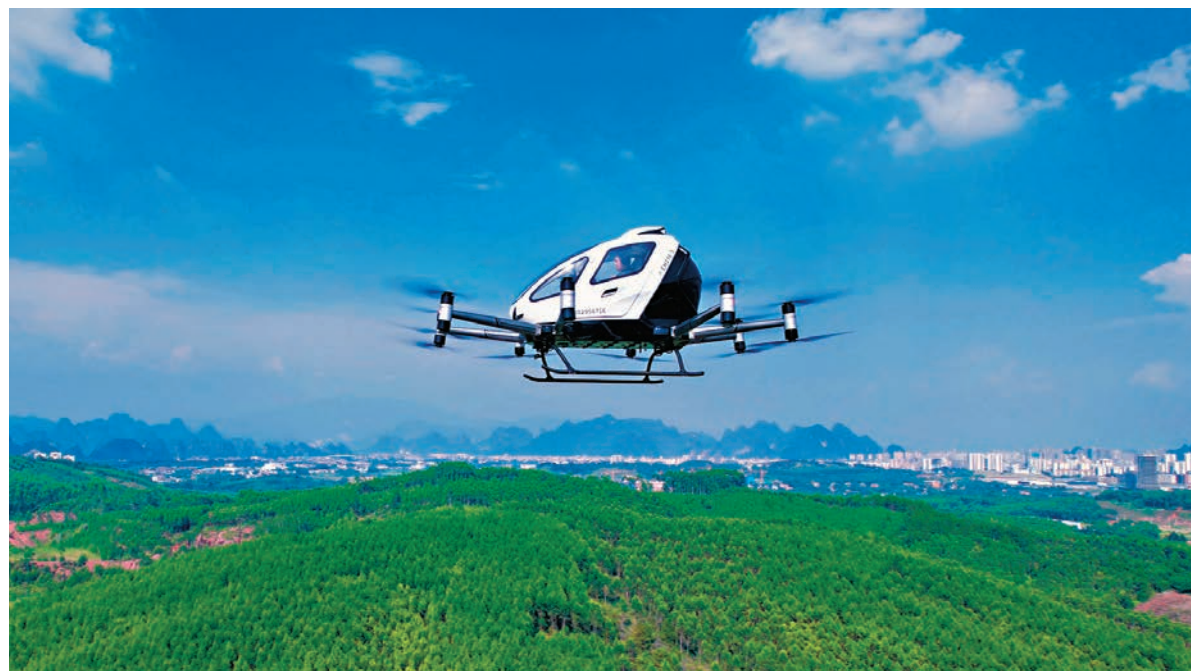
◆ 智能航空器有望作為「空中的士」飛行在香港上空。

2. 低空觀光： 低空觀光是指利用無人機等航空器進行的觀光活動。通過無人機的航拍功能，遊客可以從空中欣賞風景名勝、城市美景等，獲得獨特的視角和體驗。這種低空觀光不僅可以滿足遊客的觀光需求，還可以促進旅遊業的發展和經濟增長。例如，在一些風景名勝區，遊客可以通過無人機進行航拍，欣賞到更廣闊的景色。