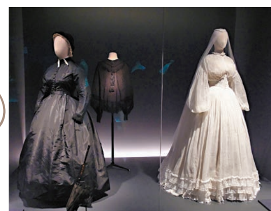
◆全黑與全白服飾，分別為女性的葬禮與婚禮穿搭。

與購物街接連開業，讓不斷擴大的中產階級有更多機會接觸時尚服飾，新發明的合成染料也使女裝的色彩更加鮮艷亮麗。隨着法國對外貿易激增，上流社會女性對社交服飾的需求量大，奢侈品市場興旺。