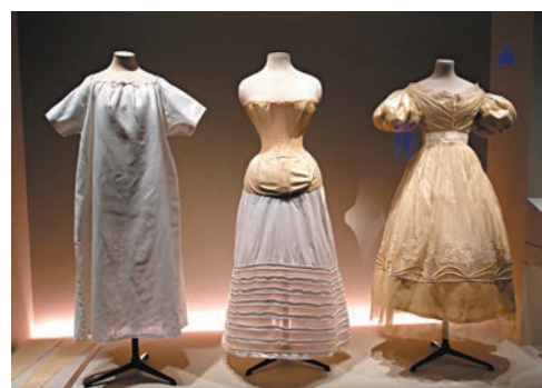
由左至右顯示穿衣順序。