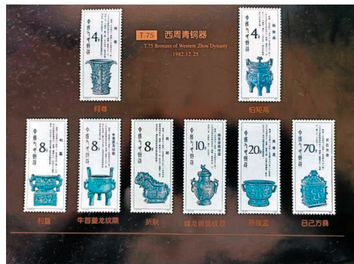
◆《西周青銅器》郵票（1982年）

古代藝術精品的再現，增長了很多文物知識，還有很大一個原因，是由於古代銅器名稱中有許多難讀難認之字，這讓人們在使勁背記的過程中，印象特別深刻。如飲酒器「觚」讀作「孤」（gū），溫酒器「罍」讀作「甲」（jià），飲酒器「觥」讀作「工」（gōng），盛酒器「卣」讀作「有」（yǒu）等。