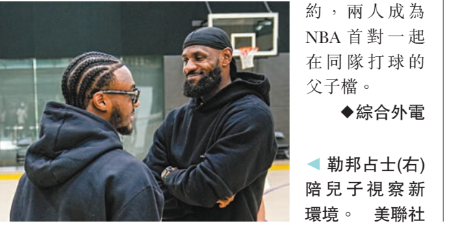
勒邦占士(右)陪兒子視察新環境。

綜合美國多個媒體報道，美職籃(NBA)超級球星勒邦占士已同意與洛杉磯湖人簽下兩年1.04億美元(約8.1億港元)的頂級合約，當中第二年是球員選項，並帶交易否決權。湖人上周在選秀第2輪選中勒邦占士的19歲大兒子布朗尼占士，簽下4年790萬美元的合約，兩人成為NBA首對一起在同隊打球的父子檔。