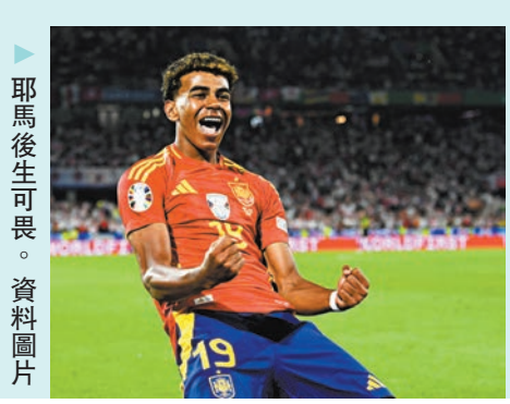
耶馬後生可畏。

球3個助攻，令到球隊邊路進攻更加銳利。而德國隊的一對翼鋒新星穆西亞拿和科利安華迪斯，亦分別有3個及1個「士哥」入賬。今屆賽事將成他們再上一層樓的舞台，小兵們力爭為球隊爭立大功。