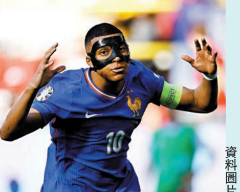
麥巴比的發揮受面罩影響。資料圖片