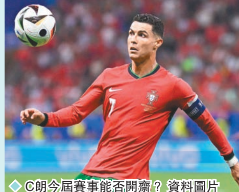
C朗今屆賽事能否開齋？資料圖片

至於葡法戰，上屆世界盃亞軍法足本屆歐國盃進攻失靈，只憑兩個烏龍及一球12碼入了共3球，表現平淡；葡軍則予人反覆之感，16強要互射12碼才擊敗實力平平的斯洛文尼亞隊。這兩支各有自身問題的隊伍，是役隨時也會踢得謹慎，有機會法定時間內難分勝負。