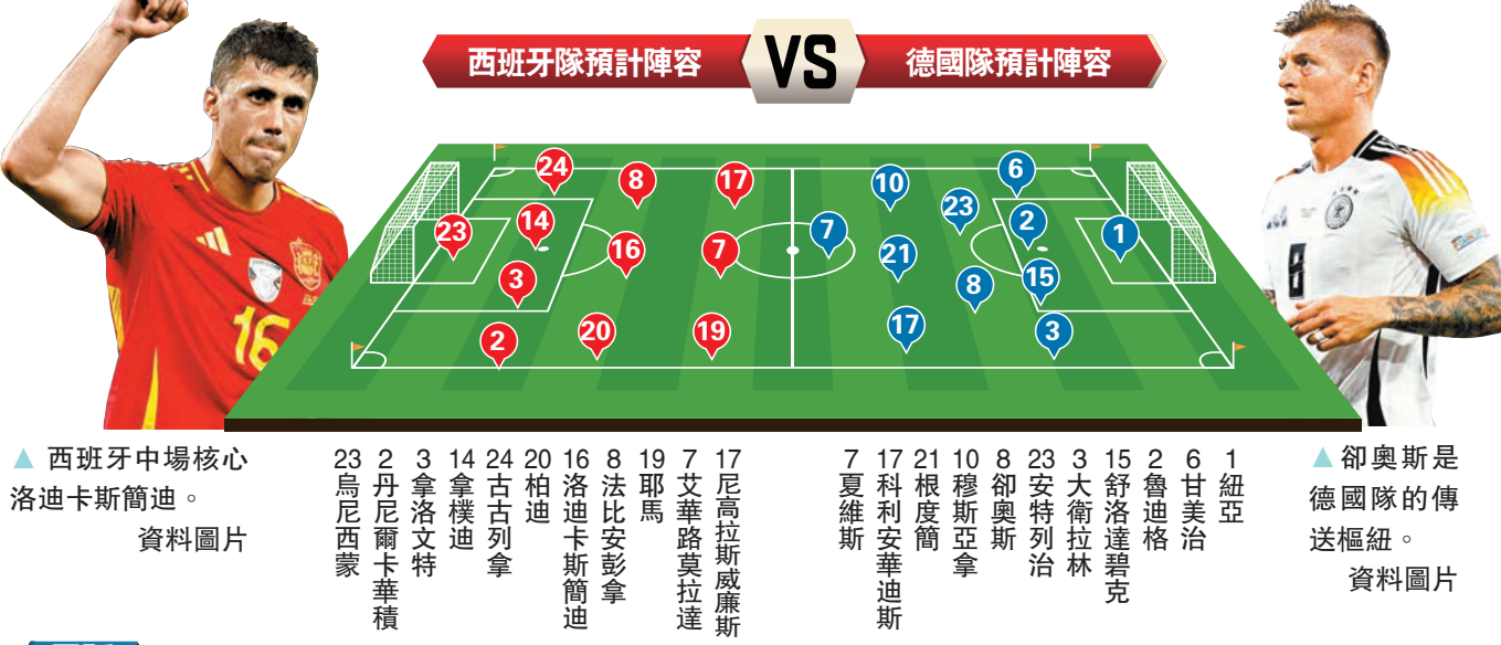
▲西班牙中場核心洛迪卡斯簡迪。資料圖片