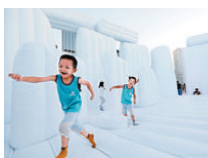
▲「英國巨石陣」跳彈床吸引了不少小朋友入內玩耍。