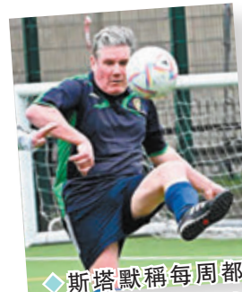
◆斯塔默稱每周都去踢球。網上圖片

香港文匯報訊 英國新任首相斯塔默出身傳統藍領家庭，被媒體形容為是當代最草根的首相。61歲的斯塔默童年時家境窘迫，曾經歷交不起生活雜費和電話被停用的困境。在4名兄弟姊妹中，斯塔默被稱為「超級男孩」，因他從學業、音樂以至足球全都擅長。作為一名出色的長笛演奏者，他曾在倫敦市音樂戲劇學院獲得青年獎學金。