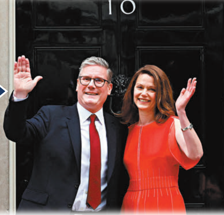
◆斯塔默(左)和妻子維多利亞在唐寧街10號與民眾見面。

《衛報》首席專欄作家貝爾指出，今次選舉體現英國政治環境變化，選民們開始更重視政客們的實際表現，關注其是否兌現競選承諾，「被意識形態狂熱主導的時代已結束，政府的發展前景將更多取決於其實際治理成果。」