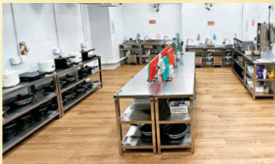
◆社區客廳的大廚房、洗衣房和學生功課室都很受劏房家庭歡迎。