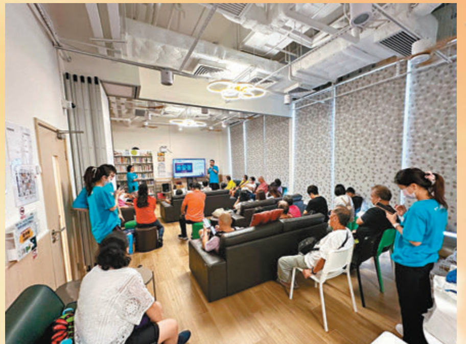
◆天氣酷熱，有冷氣的社區客廳，成為劏房戶「避暑勝地」。