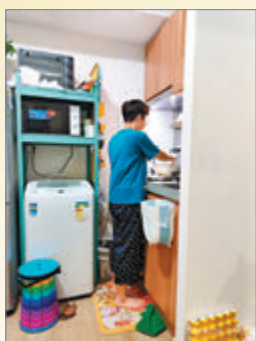
◆李太太一家四口都對過渡屋十分滿意。