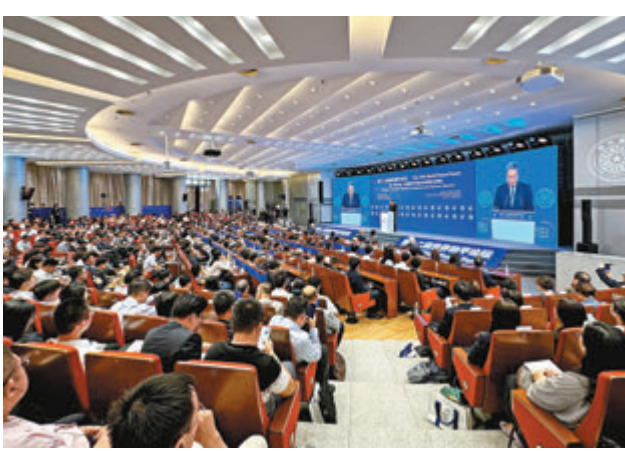
◆第十二屆世界和平論壇現場。

在發表演講前，鳩山由紀夫雙手合十，向為保護日籍母子不幸去世的蘇州胡友平女士表示哀悼。