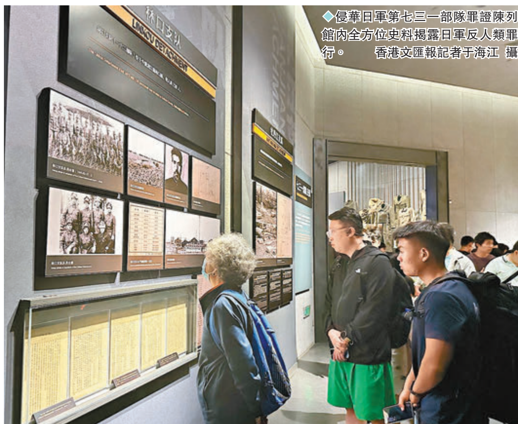
◆侵華日軍第七三一部隊罪證陳列館內全方位史料揭露日軍反人類罪行。