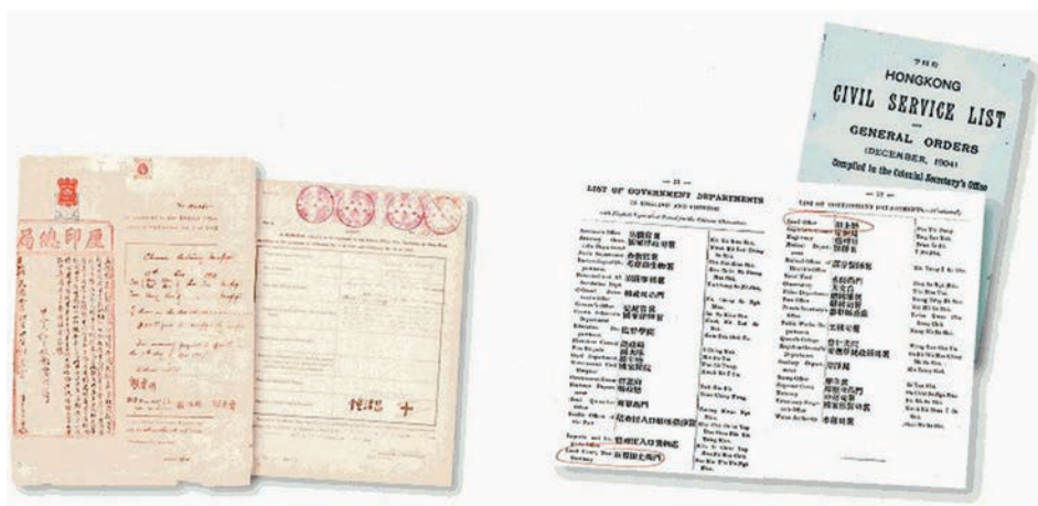
◆舊有地契及就土地買賣發出的公告。

立法會負責審議該條例草案的法案委員會主席林健鋒表示，政府在審議過程中多次強調條例並不改變政府一直秉承的1997年7月的土地政策，亦不影響政府在地契續期的完全酌情決定權。他指出，今