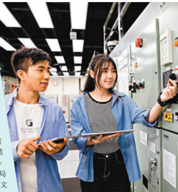
◆機電工程高級文憑。