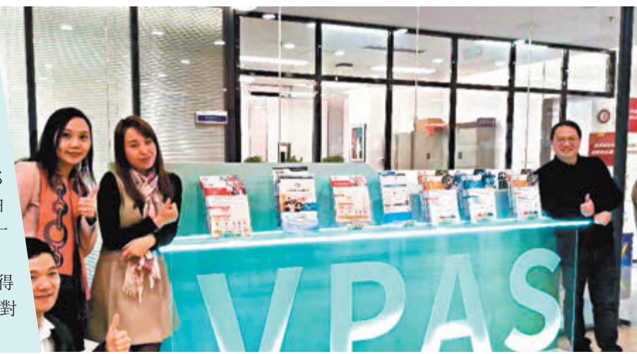
◆「職專畢業生留港計劃」創新及科技業宣講會1月27日在深圳圓滿結束。

「我準備短期內繼續上英文提升課，希望能獲得面試機會，用流利的英文來爭取加分。」白同學對通過該計劃赴港讀書充滿興趣和期待。