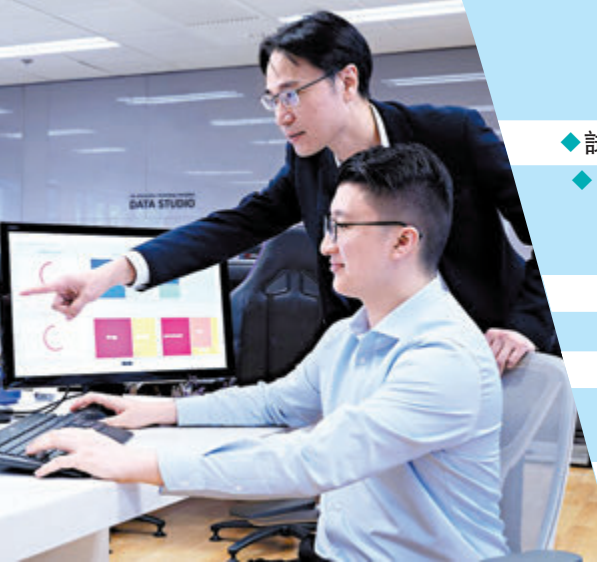
◆數據科學及人工智能高級文憑。