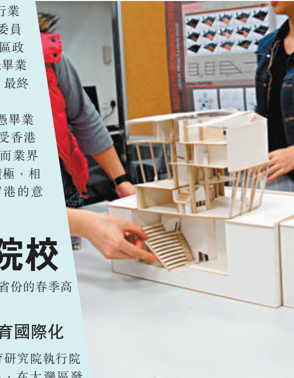
◆建築、土木工程及建設環境專業。