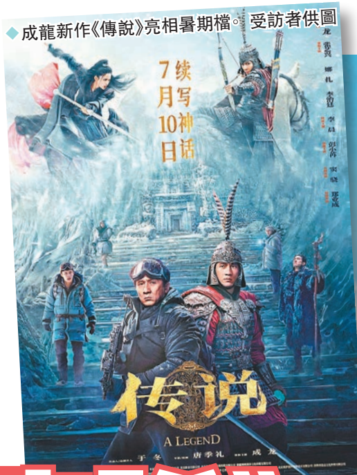
◆成龍新作《傳說》亮相暑期檔。

香港文匯報訊（記者 馬曉芳 北京報道）19年前，成龍（大哥）主演的電影《神話》全國上映，在當年電影票只有10元人民幣的條件下成為首部票房過億的國產電影。19年後，成龍帶著電影《傳說》亮相暑期檔，於7月10日正式上映。導演兼編劇唐季禮表示，金戈鐵馬、蕩氣迴腸的《傳說》比《神話》更豐富。影片預告片中AI再現了成龍27歲時的樣貌，大哥通過電影「再少年」，對此成龍幽默表示：「還是喜歡我現在的樣子，很開心自己可以變老。」他亦坦言，如果拍電影能對維護中國文化、守護中國國寶盡一份力，就覺得很開心。