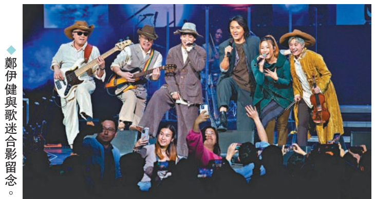
◆鄭伊健與歌迷合影留念。