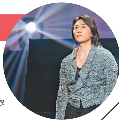
◆鄭伊健被歌迷感動一度哽咽。