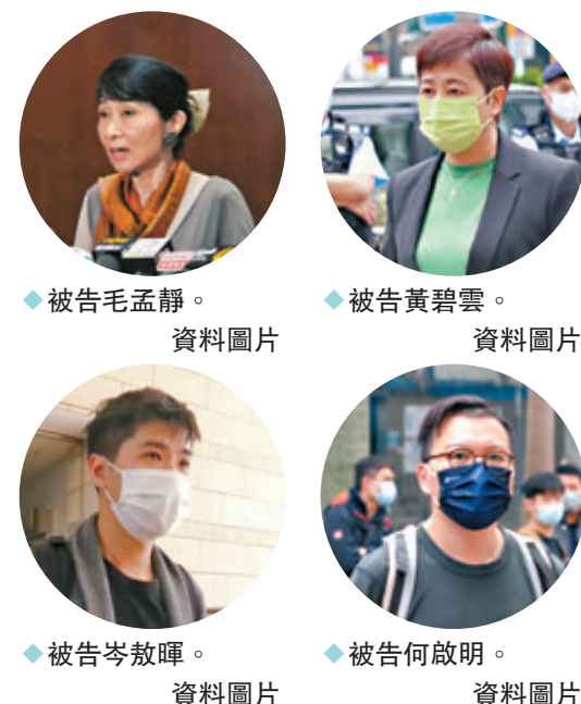
◆被告毛孟靜。 資料圖片