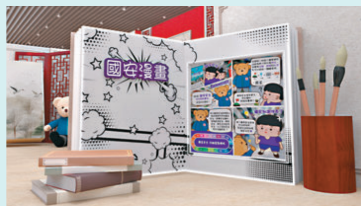
◆展覽新增國安主題漫畫和動畫，以活潑生動的方式推廣國安教育。

香港國安法網上虛擬展覽於2021年推出，旨在加深公眾人士對國安法的立法背景、重要性及意義的認識，至今參觀人次已超過58萬。