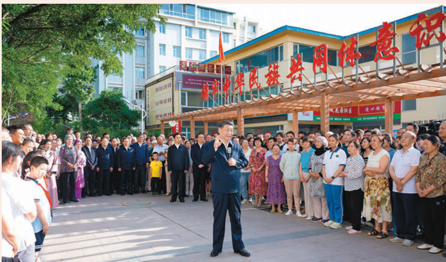
◆2024年6月19日下午，中共中央總書記、國家主席、中央軍委主席習近平在寧夏回族自治区考察調研。他來到銀川市金鳳區長城花園社區，了解社區發揮基層黨組織作用、優化便民惠民服務、推動各族群眾交往交流交融等情況。 資料圖片