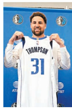
◆基利湯遜改穿獨行俠31號戰袍。

美職籃(NBA)球星基利湯遜離開金州勇士後，昨日亮相新東家達拉斯獨行俠，將會穿上獨行俠的31號球衣。他表示，十分期待與獨行俠王牌當錫的合作，有信心大家可以聯手創造佳績，「我欣賞無畏無懼、競爭到底的人，盧卡(當錫)就是這樣的人。我相信我們將能發揮出彼此最好的一面。」在勇士13年間贏得4次NBA總冠軍的他，近賽季