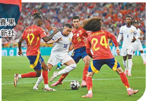
◆麥巴比(左二)試圖突破重圍。