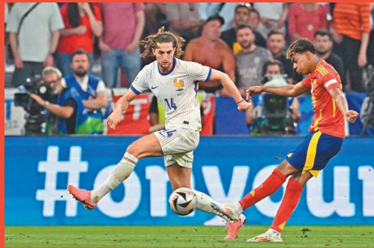
◆耶馬禁區外起腳。