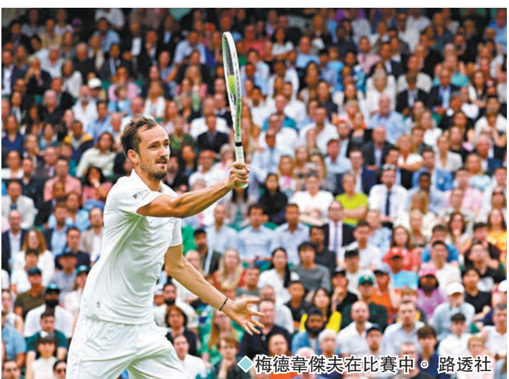
◆梅德韋傑夫在比賽中。