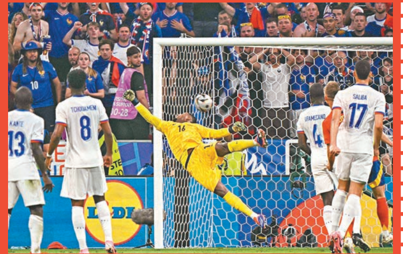
◆皮球彎向龍門彈左柱內側入網。