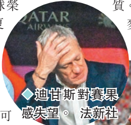
◆迪甘斯對賽果感失望。

麥巴比上屆世界盃以8個入球榮膺神射手，但在一年半後的今夏歐國盃卻只有1個12碼入球。因為鼻骨受傷由分組賽第3輪到8強都戴上保護面具比賽，曾投訴因而視線受汗水影響的麥巴比，今仗沒有戴面具上陣，可是完場前的入球良機卻還是未能把握到，當時他左路推橫大位只面對對方門將烏尼西蒙一人，結果射門卻越門楣而出。「我推過了後衛，當時我想必須入球，至少要射正。結果球越楣而出，這就是足球的殘酷。1:2，我們要回家了。」他承認，「我們做得不夠好，不足以打入決賽。」