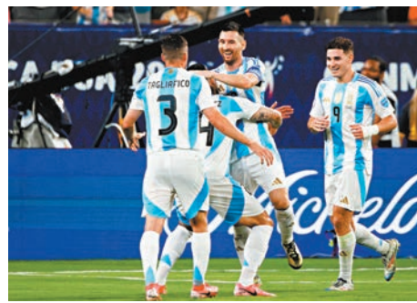
◆阿根廷隊友抱起美斯(右二)慶祝入球。

阿根廷國家隊在當地時間9日的2024美洲盃決賽中，以2:0戰勝加拿大隊，闖入決賽，距離成功衛冕僅一步之遙。入球功臣之一的隊長美斯賽後感嘆能夠再次打入決賽是件「瘋狂的事」，而他賽後一句「最後的戰鬥」，亦引起了球迷對他會否在本屆賽事後宣布退出國家隊的猜測。