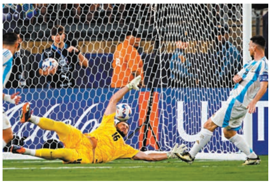
◆美斯(右)入球瞬間。

據新華社報道，祖利安艾華里斯在第23分鐘破門得分，為阿根廷隊先拔頭籌。易邊之後，美斯在第51分鐘攻入他本屆賽事的首個進球。2:0領先後的阿根廷隊採取防守反擊戰術，加拿大隊進攻機會增多，但始終無法得分，結果繼小組賽後再一次敗給對手。賽後美斯表示：「我們再一次打入(美洲盃)決賽是一件瘋狂的事。這