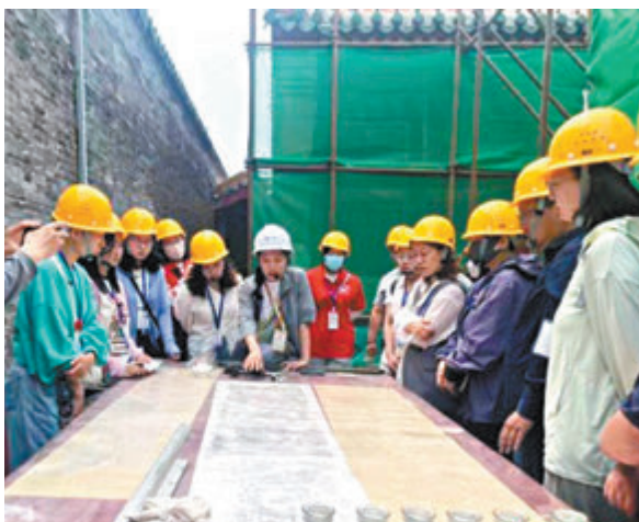
◆工作人員為體驗者介紹修復程序。