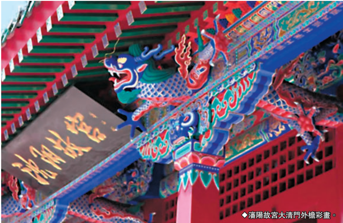
◆瀋陽故宮大清門外檐彩畫。