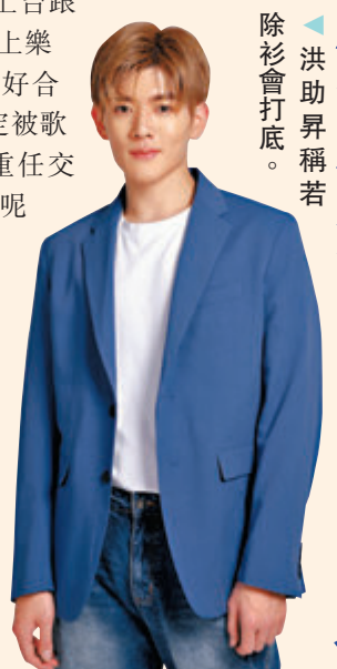
洪助昇稱若除衫會打底。